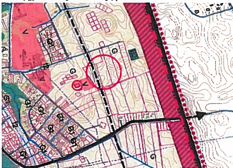
I pav. Ištrauka iš bendrojo plano (Pertvarkoma teritorija pažymėta mėlynai)

Pagal Klaipėdos miesto savivaldybės bendrąjį planą, pertvarkoma teritorija patenka į Kitos paskirties žemę: Gyvenamosios teritorijos (tp6, G) teritorija, skirta gyvenamųjų namų statybai; Mažaaukščių gyvenamųjų namų statybos (tp6, G1) žemės sklypai, kuriuose yra esami arba numatomi statyti vieno ar trijų aukštų gyvenamieji namai ir jų priklausiniai.