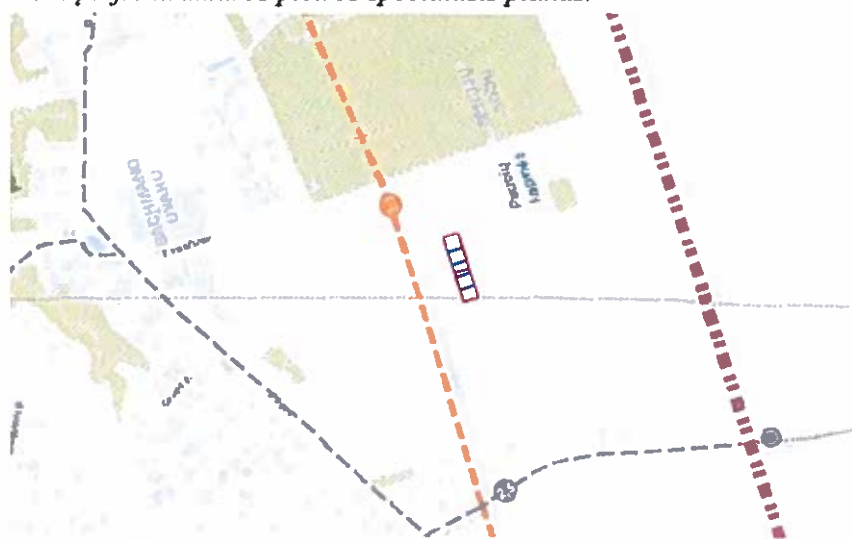
3 pav. Ištrauka iš Klaipėdos miesto dviračių infrastruktūros plėtros specialiojo plano (Pertvarkoma teritorija pažymėta raudonai- mėlynai)

Klaipėdos miesto savivaldybės tarybos 2015 m. rugsėjo 9 d. sprendimu Nr. T2-247 patvirtintas Klaipėdos miesto dviračių infrastruktūros plėtros specialusis planas.