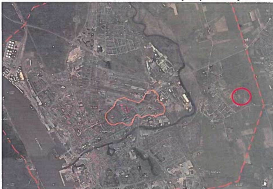
4 pav. Ištrauka iš Klaipėdos miesto pirmosios vandenvietės Liepų g. 49A sanitarinės apsaugos zonos specialiojo plano (Pertvarkoma teritorija pažymėta raudonai)

Klaipėdos miesto savivaldybės tarybos 2009 m. sausio 29 d. sprendimu Nr. T2-17 patvirtintas Klaipėdos miesto pirmosios vandenvietės Liepų g. 49A sanitarinės apsaugos zonos specialusis planas.