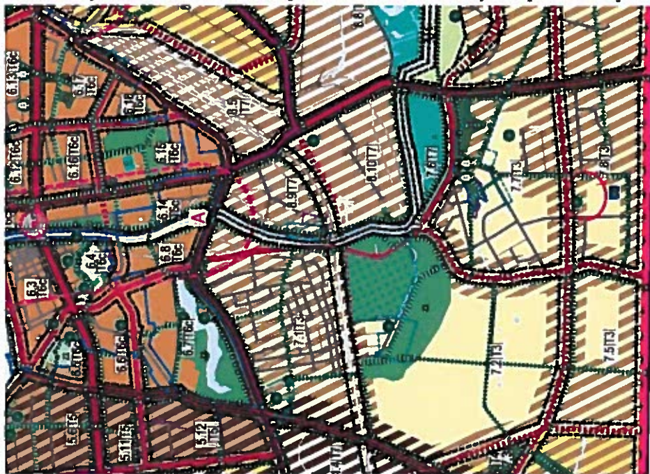
5 pav. Ištrauka iš Klaipėdos miesto mažosios architektūros aplinkotvarkos įrangos išdėstymo bei aplinkos estetiško formavimo, miestietiškojo kraštovaizdžio tvarkymo specialiojo plano (Pertvarkoma teritorija pažymėta raudonai)

Klaipėdos miesto savivaldybės administracijos direktoriaus 2015 m. gruodžio 3 d. įsakymu Nr. AD1-3561 patvirtintas Klaipėdos miesto mažosios architektūros aplinkotvarkos įrangos išdėstymo bei aplinkos estetiško formavimo, miestietiškojo kraštovaizdžio tvarkymo specialusis planas.