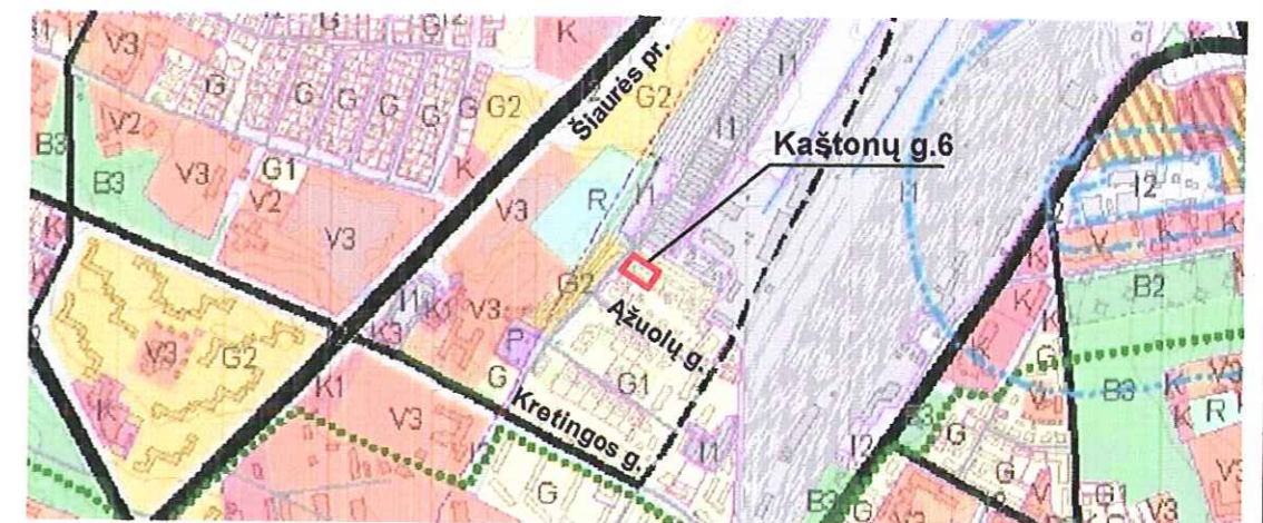
ŽEMĖS SKLYPO PLANO APRAŠOMOJI LENTELĖ