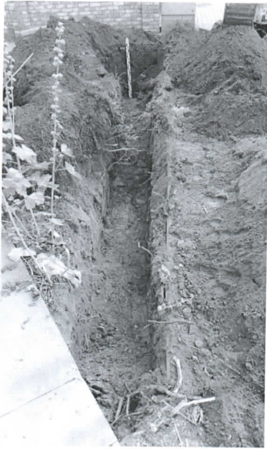
Bendras tranšėjos vaizdas po tyrimų. Vaizdas iš PV pusės