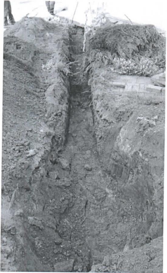
Bendras tranšėjos vaizdas po tyrimų. Vaizdas iš ŠR pusės