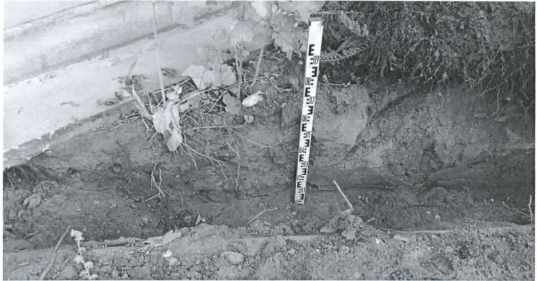
ŠR tranšėjos sienelė ties namo pamatu, tranšėjos pradžioje. Vaizdas iš PR pusės