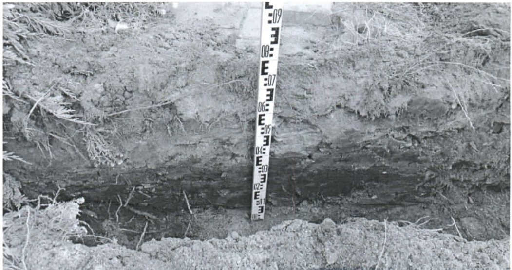
ŠR tranšėjos sienelė ties tranšėjos viduriu. Vaizdas iš PR pusės