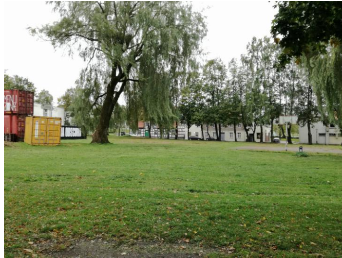
Tyrimų vieta iš ŠR