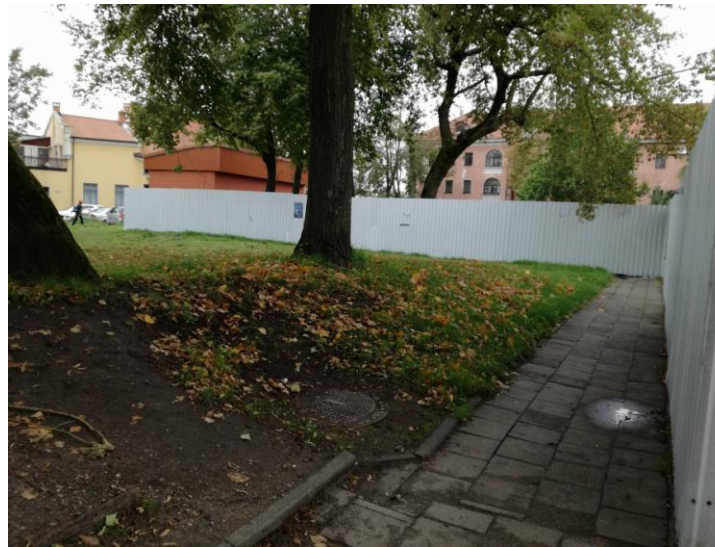
Tyrimų vieta iš PR