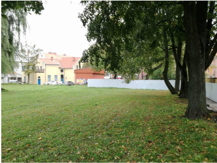
Tyrimų vieta iš PR