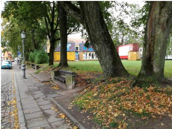
Tyrimų vieta iš ŠV