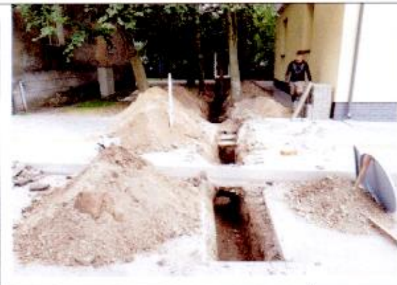
7. Bendras tranšėjos Nr. 1 vaizdas iš ŠR