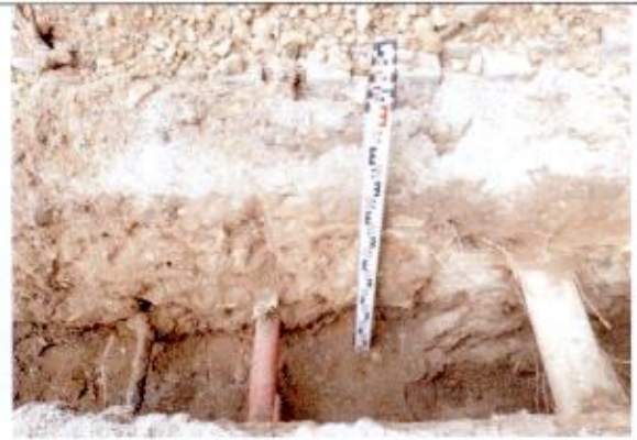
2. Sp 2, vaizdas iš ŠV