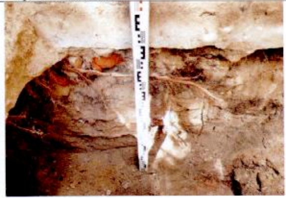
6. Sp 6, vaizdas iš PR