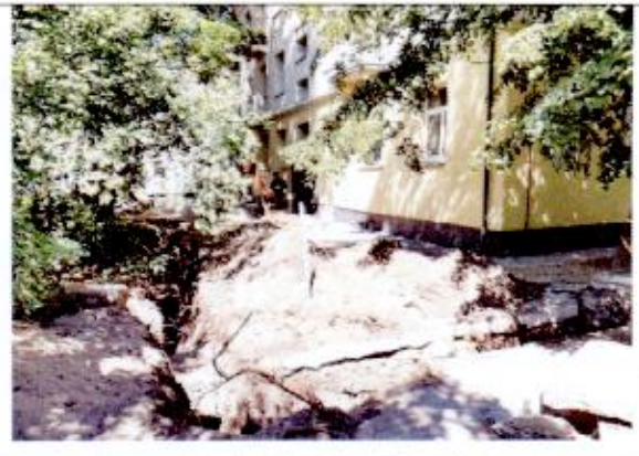
8. Bendras tranšėjos Nr. 1 vaizdas iš PR