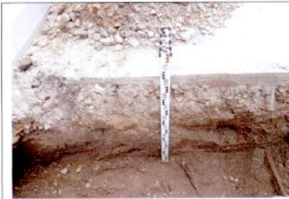
1. Sp 1, vaizdas iš R