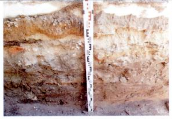
4. Sp 4, vaizdas iš ŠV