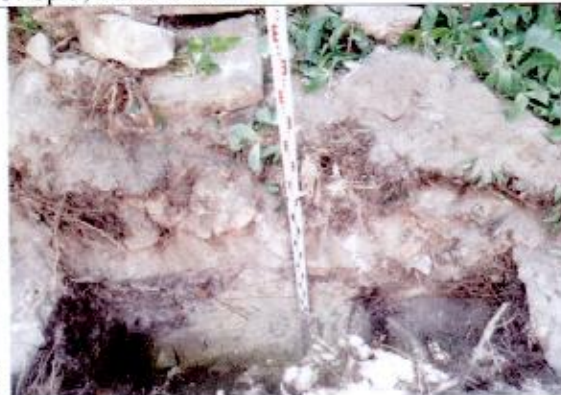
5. Sp 5, vaizdas iš ŠR