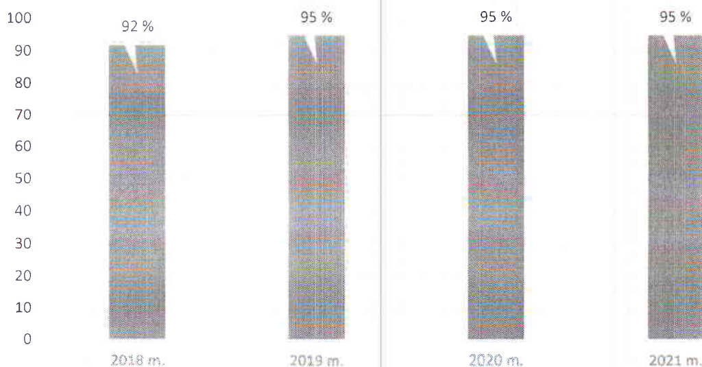
Planuojamas rekomendacijų įgyvendinimo procentinio santykio pokytis 2018-2021 m.