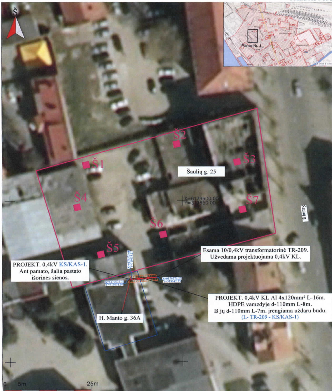
Planas Nr. 1 Klaipėdos miesto istorinės dalies, vad. Naujamiesčių (22012) teritorijos, Klaipėdos m. sav., Klaipėdos m., H. Manto g. 36A 2019 m. archeologinių žvalgymų situacijos planas. M 1:500.

—●— 2019 m. žvalgyta elektros kabelio trasa