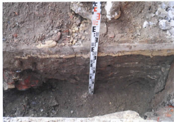
5. Elektros kabelio tramos stratigrafija. Vaizdas iš PR.