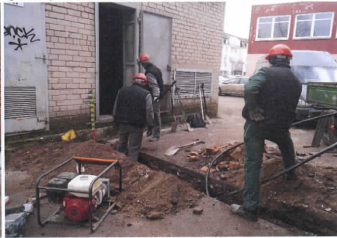
4. Kasama elektros kabelio trasa. Vaizdas iš PR.