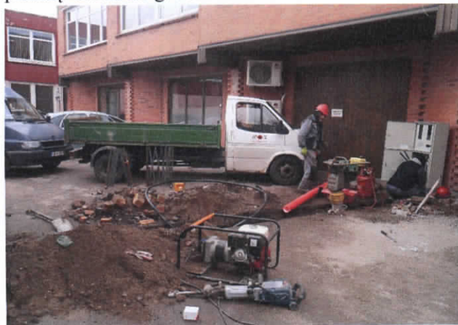
3. Kasama elektros kabelio trasa.