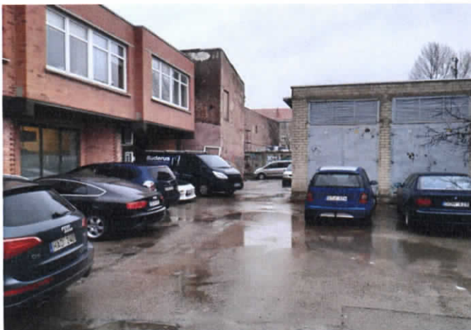
1. Planuojamo tiesiti elektros kabelio įvado į pastatą H. Manto g. 36A vieta. Vaizdas iš R.