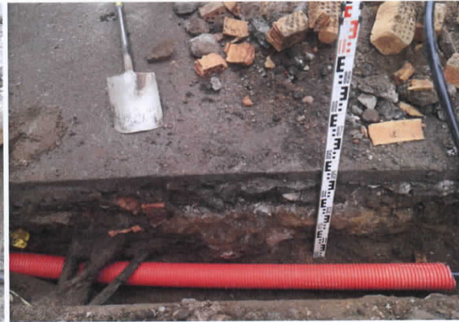
6. Elektros kabelio tramos stratigrafija. Vaizdas iš PR.