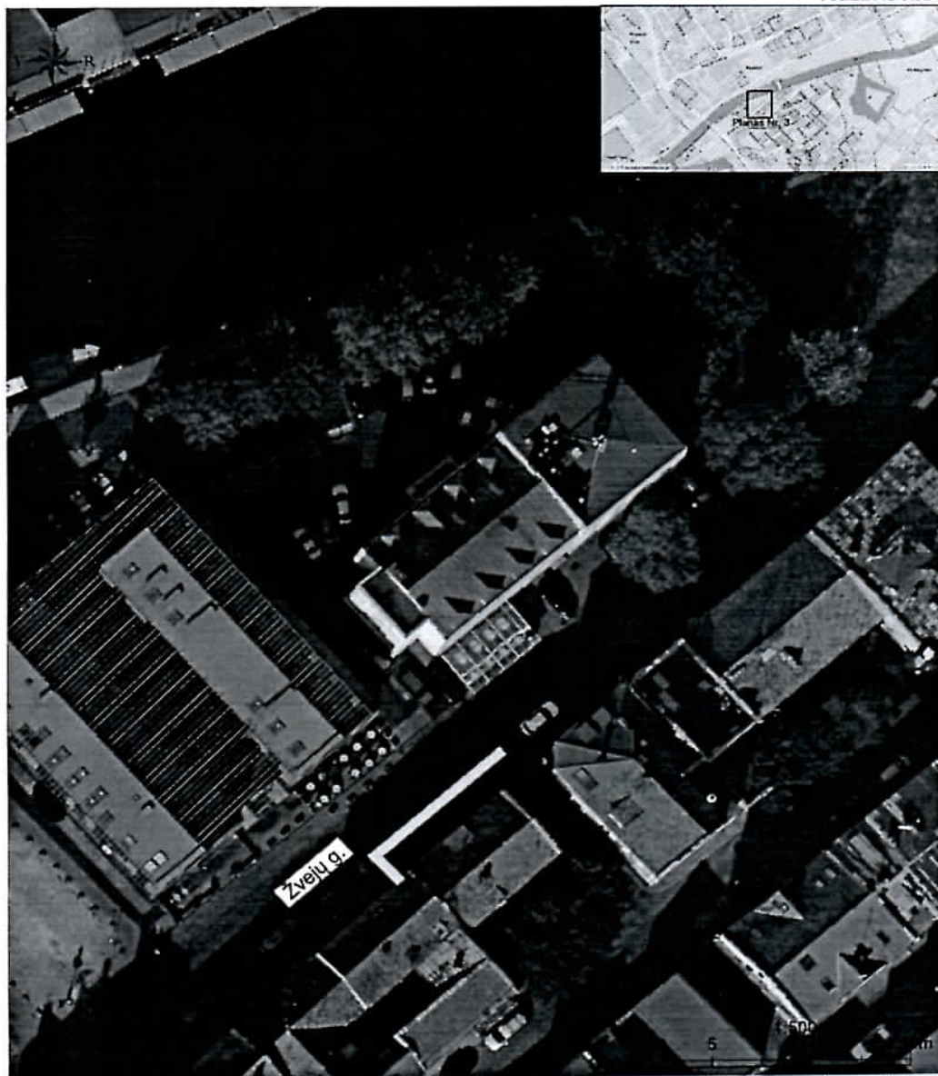
Planas Nr. 3 Klaipėdos senojo miesto vietos su priemiesčiais (27077) ir Klaipėdos senamiesčio (16075), Klaipėdos m. sav., Klaipėdos m., Žvejų g. 9 2019 m. archeologinių žvalgymų situacijos planas. M 1:500.

— 2019 m. archeologinių žvalgymų vieta - planuojamas tiesiti telekomunikacijų kabelis