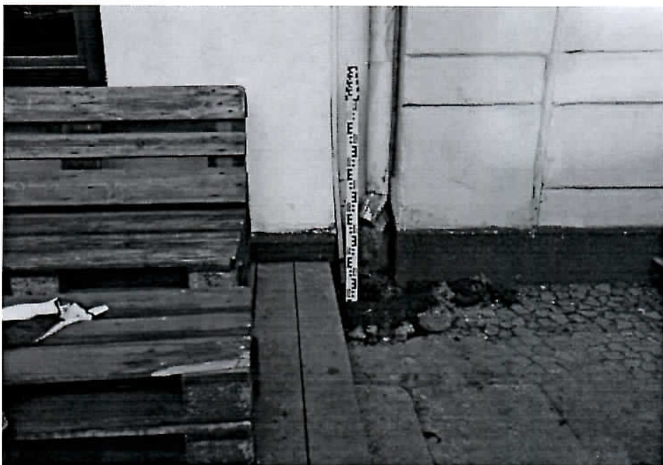
Fot.3 Žvejų g. 9 prieduobė iš V