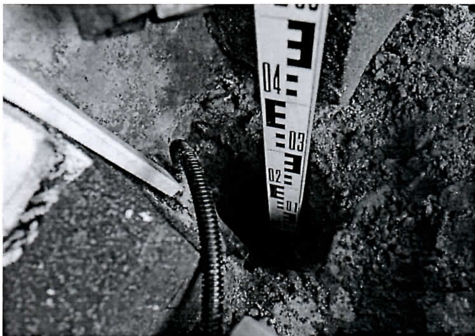
Fot.4 Prieduobės sienelės pjūvis iš V