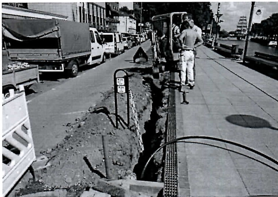
Fot.1 Danės g. 9 tranšėja iš PV