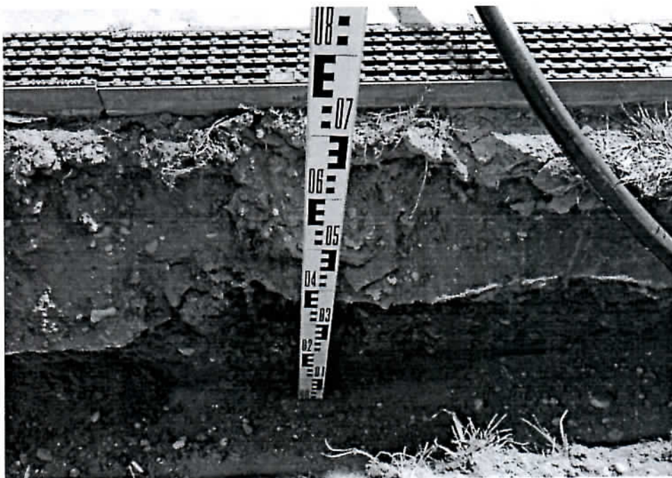
Fot. 2 Tranšėjos sienelės pjūvis iš PR