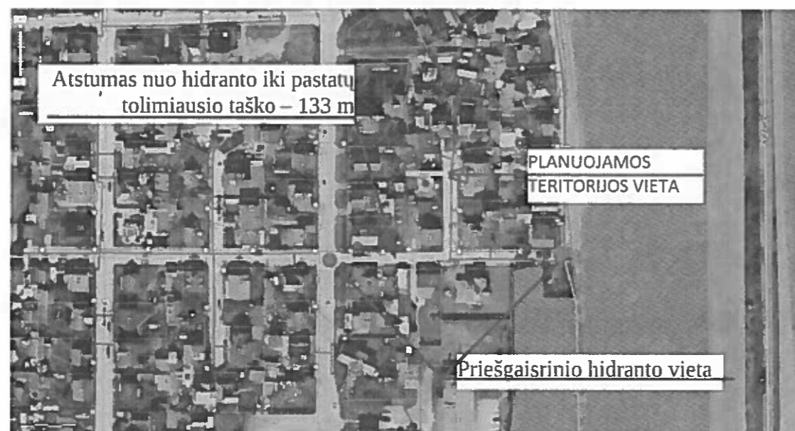
Pav. 2. Situacijos schema

Statiniai turi būti suprojektuoti taip, kad kilus gaisrui: