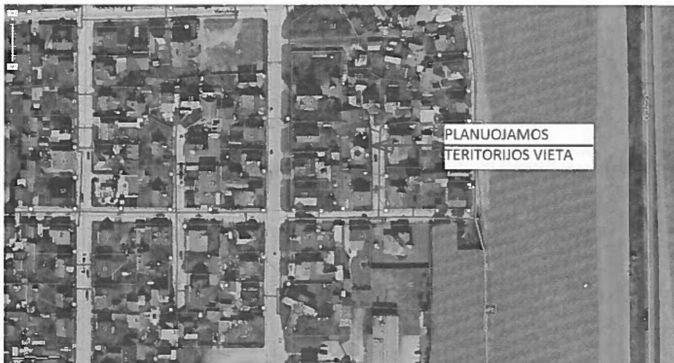
Pav. 1. Orofoto ištrauka su gretimų teritorijų ir kvartalo užstatymu

Detaliojo plano tvarkymo režimo pagrindinių sprendinių aprašomoji lentelė pateikiama pagrindiniame brėžinyje.