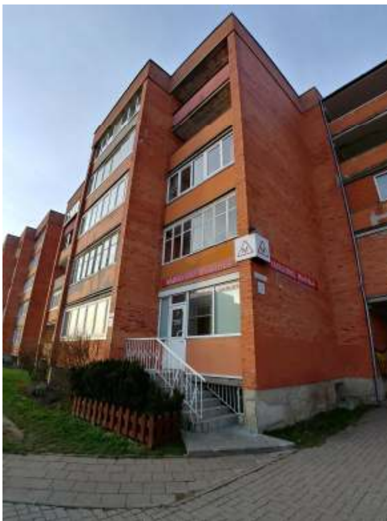
Pietinė g. 3-1, Klaipėdoje pietinio fasado fragmento fotofiksacija-esama padėtis.