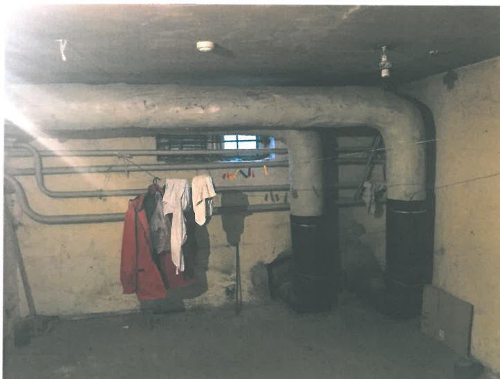
Fotofiksaija Nr. 1 Esama situacija su trečio lango vieta

NUTARTA: negyvenamosios patalpos-rūsio patalpos paskirties keitimo į prekybos paskirties patalpas atliekant pastato kapitalinį remontą, Turgaus a. 2-14, Klaipėdos m., projekto projektiniams pasiūlymams pritarta.