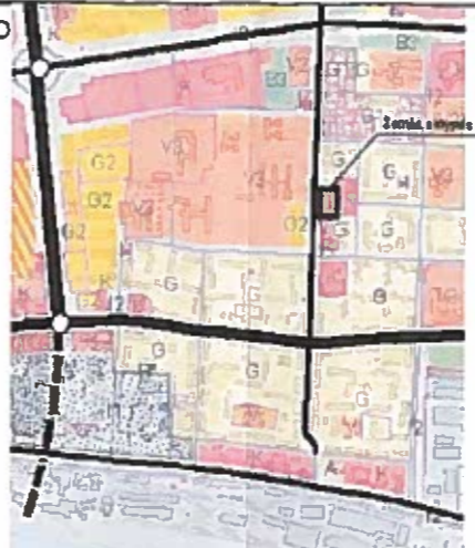
Įtrauka iš Klaipėdos miesto bendrojo plano funkcinių prioritetų grafinės dalies