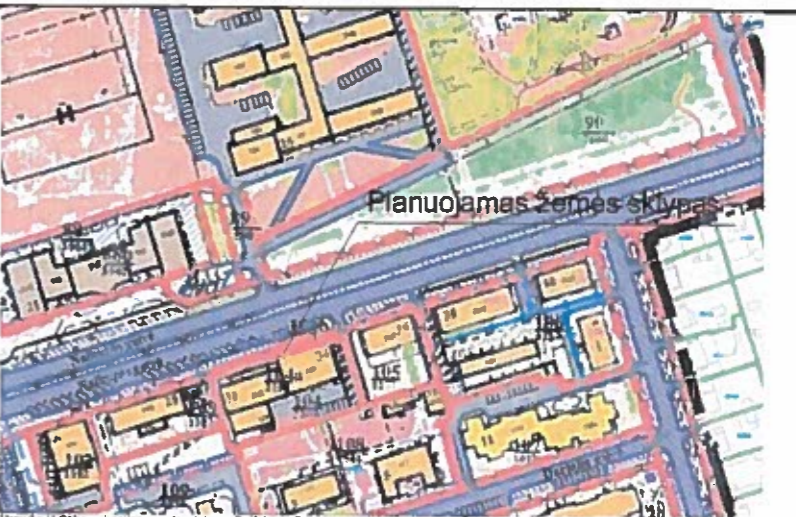
Įtrauka iš 71ha teritorijos tarp Jūreivių g., Poilsio g., Strėvos g. tęsinio, Mituvos g., Žalgirio g., Kalnupės g., Nidos g. ir Rambyno g. detaliojo plano