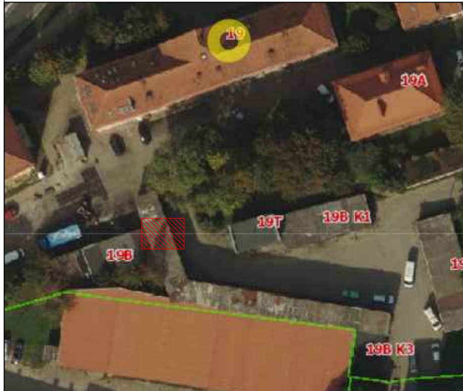
BUITINIŲ ATLIEKŲ PUSIAU POŽEMINIŲ KONTEINERIŲ AIKŠTELĖS TIPAS NR. 2 M 1:50