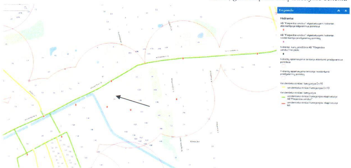
Esamų gaisrinių hidrantų išdėstymo schema

Projektuojamų pastatų atsparumo ugniai laipsnis – II. Tarp pastatų numatomas didesnis nei 8 m priešgaisrinis atstumas. Iki gretimuose sklypuose esančių pastatų atstumas yra didesnis nei 10 m. Tarp blokuotų gyvenamųjų namų, yra suprojektuota bendra, gaisrinės saugos reikalavimus