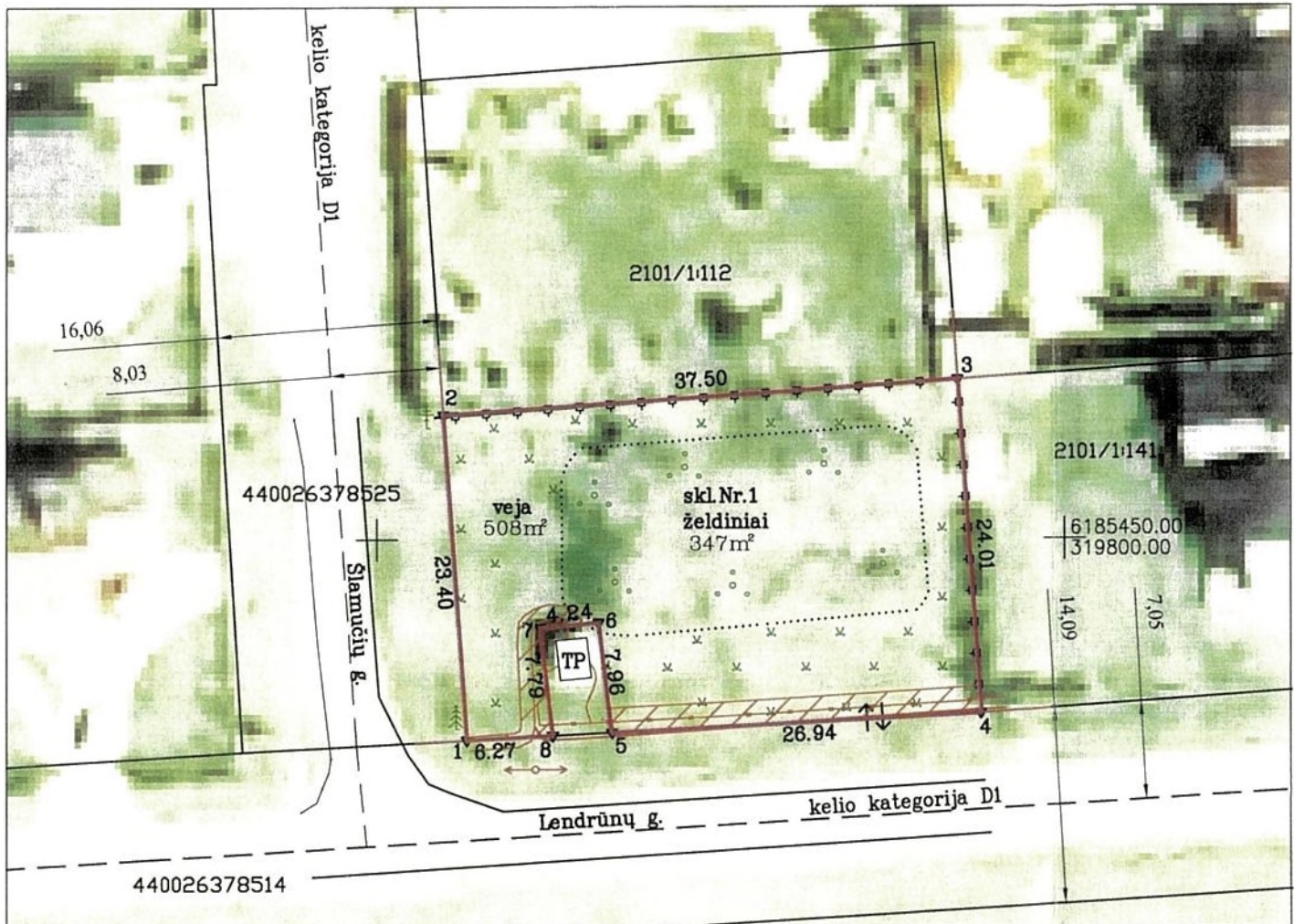
ORTIOLT c Nacionalinė žemės tarnyba prie ŽŪ ministerijos