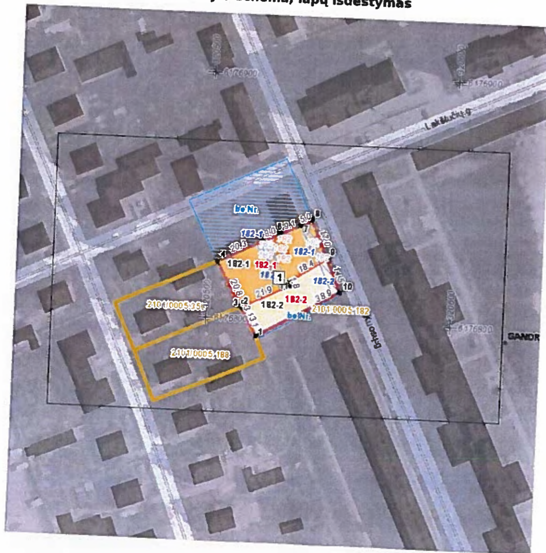
Situacijos schema, lapų išdėstymas