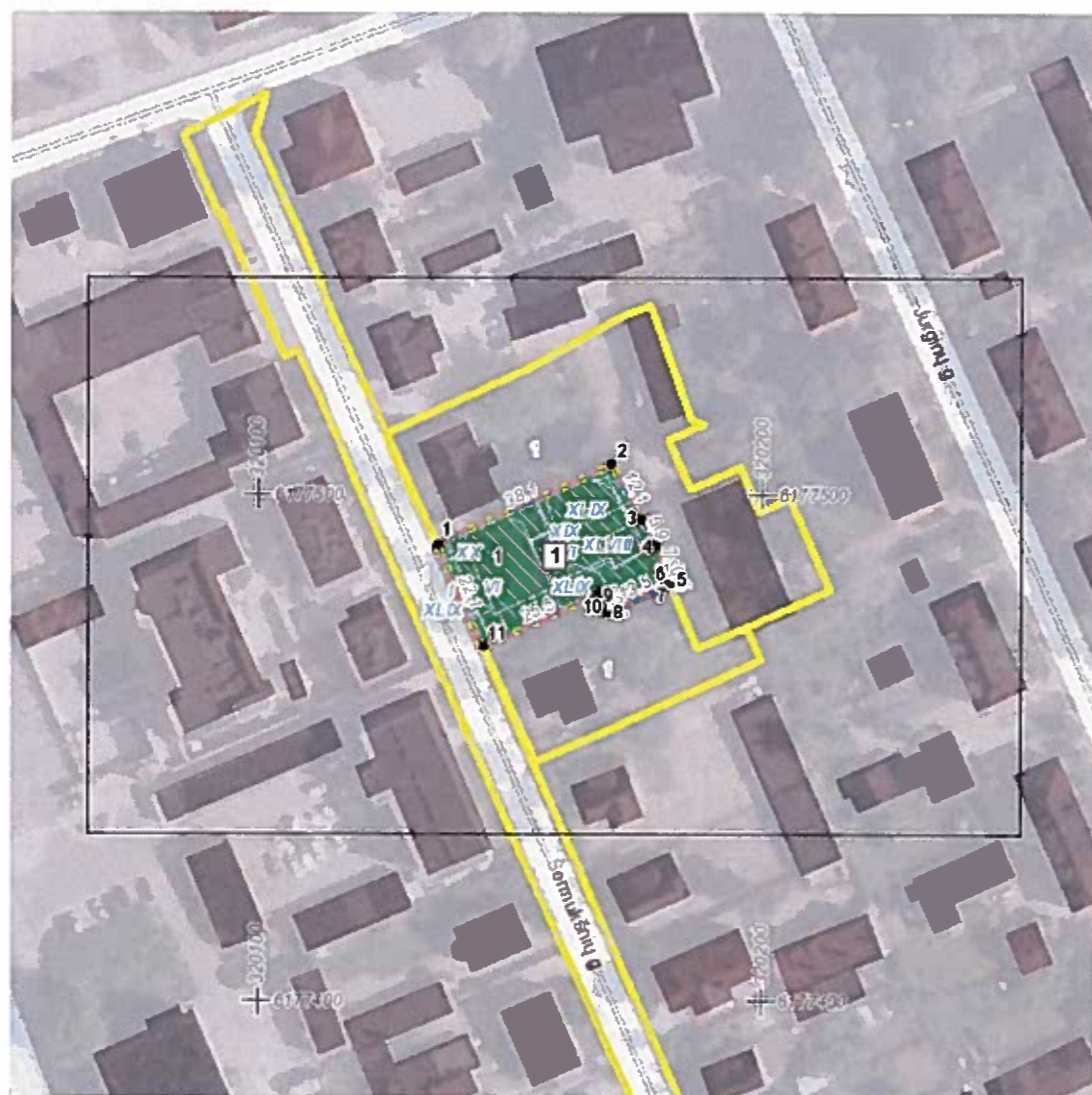
Situacijos schema, lapų išdėstymas