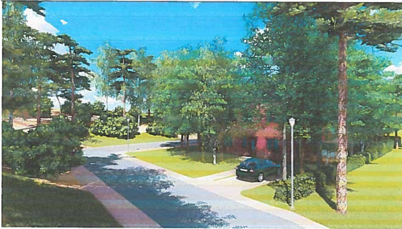
2 pav. vaizdas nuo jūros pusės į pietvakarius