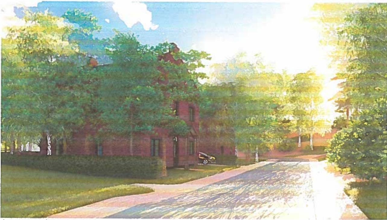
3 pav. vaizdas nuo Skautų gatvės į vakarus