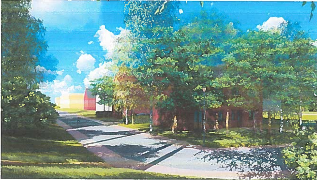
Įpav. vaizdas nuo jūros pusės į rytus