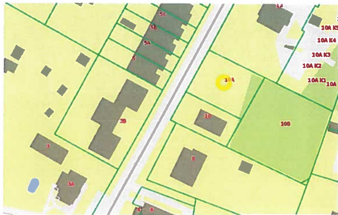
Pav. 1. Sklypo situacijos schema.

Koreguojamam sklypui įregistruotos specialiosios žemės ir miško naudojimo sąlygos ir servitutai: kelio servitutas (0.0141 ha), servitutas- teisė aptarnauti požemines, antžemines komunikacijas (0.0201 ha), saugotini želdiniai, augantys ne miško žemėje (13 vnt.), I. Ryšių linijų apsaugos zonos (0.0085 ha), VI. Elektros linijos apsaugos zonos (0.0036 ha), XLIX. Vandentiekio, lietaus ir fekalinės kanalizacijos tinklų ir įrenginių apsaugos zonos (0,0181 ha).