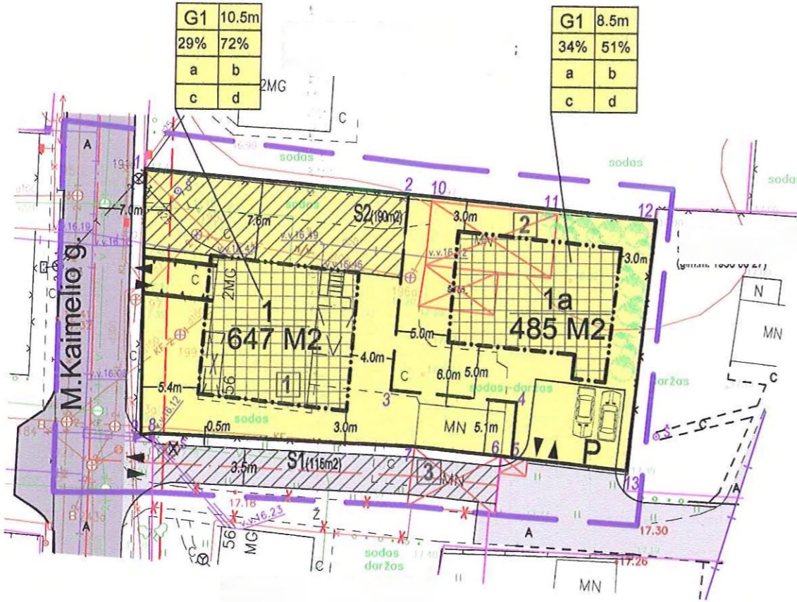
DETALIOJO PLANO TERITORIJOS TVARKYMO REŽIMO PAGRINDINIAI SPRENDINIAI 1 lentelė