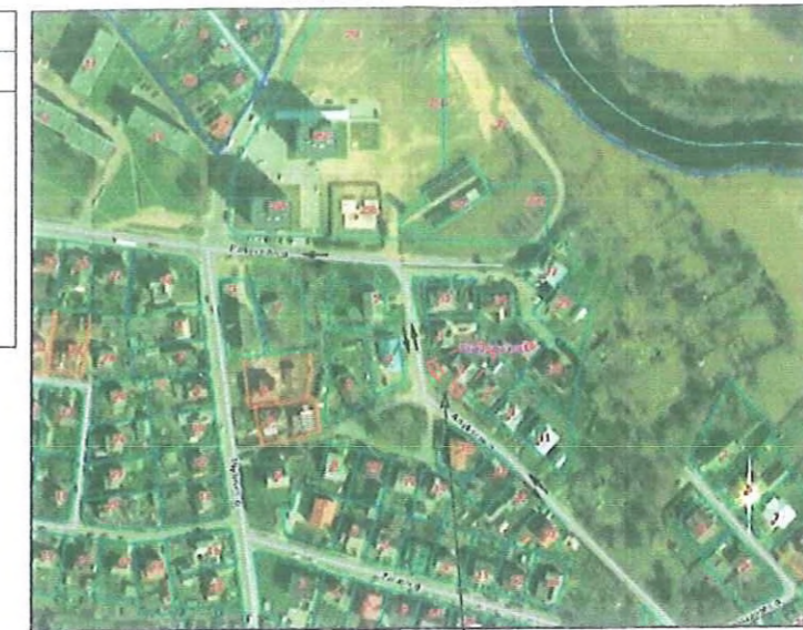
Duomenys perkelta iš Registrų centro kadastro žemėlėpio Ortofotografinė nuotrauka atlikta 2009-2010