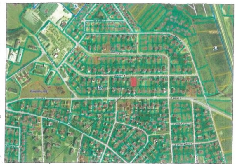
Duomenys perkelta iš Registrų centro kadastro žemėlapiu Ortofotografinė nuotrauka atlikta 2009-2010