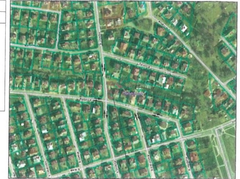
Duomenys perkelta iš Registrų centro kadastro žemėlapiu Ortofotografinė nuotrauka atliktą 2009-2010