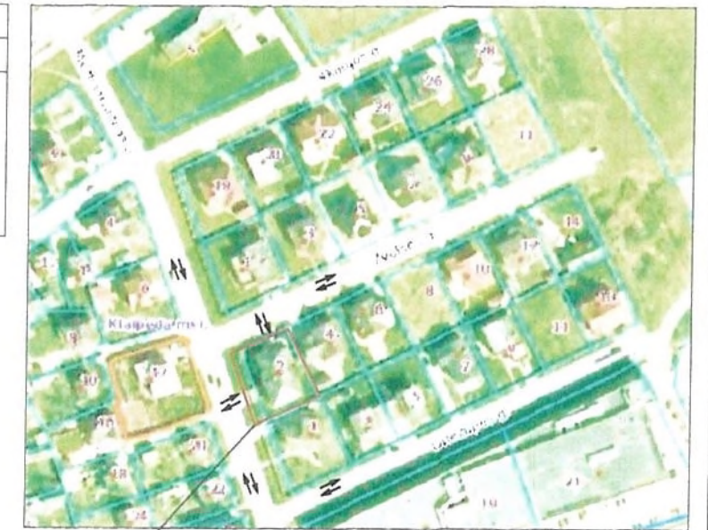
Duomenys perkelta iš Registrų centro kadastro žemėlapių Ortofotografinė nuotrauka atliktą 2009-2010