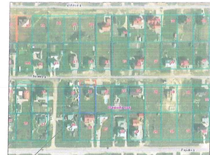
Duomenys perkelta iš Registrų centro kadastro žemėlapių Ortofotografinė nuotrauka atlikta 2009-2010