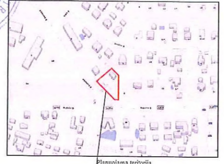
PLANUOJAMOS TERITORIJOS SITUACIJOS SCHEMA

Želdiniai. Planuojamoje teritorijoje saugotinių želdinių nėra. Želdiniai sklypą ribose sprendžiami STR ir kitų teisės aktų nustatyta tvarka arba techninio projekto rengimo metu. Vadovaujantis LR AM 2007 12 21 įsakymu Nr.D1-694 „Dėl atskirųjų rekreacinių paskirties želdynų plotų normų ir priklausančių želdynų normų (plotų) nustatymo tvarkos aprašo patvirtinimo“ 7 punktu mažiausias želdynų, įskaitant vejas ir gėlynas, plotas ne mažesnis kaip 25% viso žemės sklypo ploto.