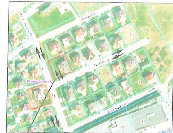
Duomenys perkelta iš Registrų centro kadastro žemėlapių Ortofotografinė nuotrauka atlikta 2009-2010