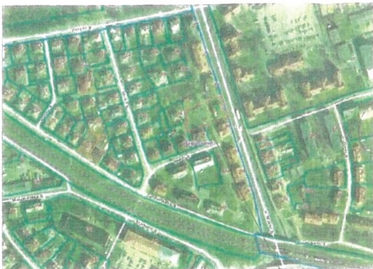
Duomenys perkelti iš Registrų centro kadastro žemėlapiu Ortofotografinė nuotrauka atlikta 2009-2010