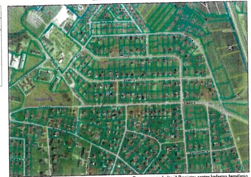
Duomenys perkelta iš Registrų centro kadastro žemėlapiu Ortofotografinė nuotrauka atlikta 2009-2010