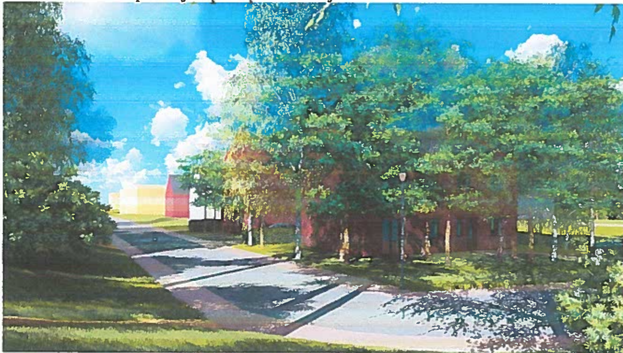
Į pav. vaizdas nuo jūros pusės į rytus