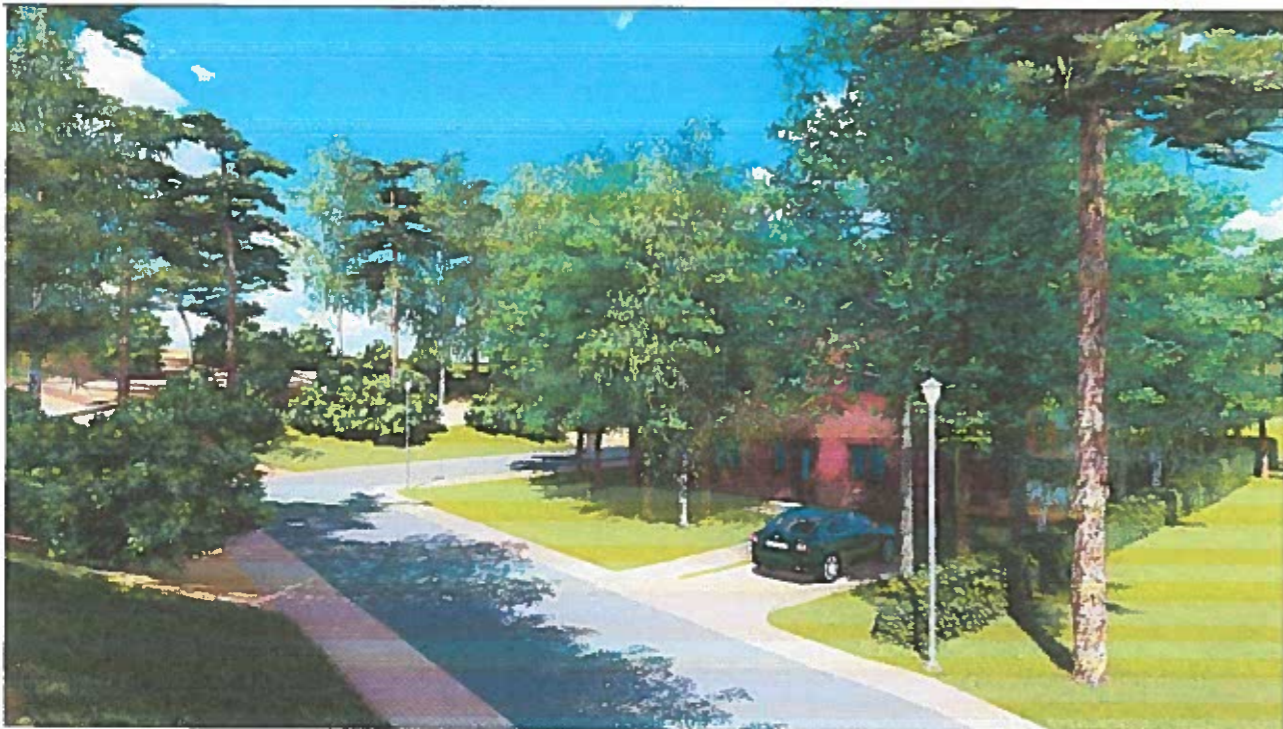
2 pav. vaizdas nuo jūros pusės į pietvakarius