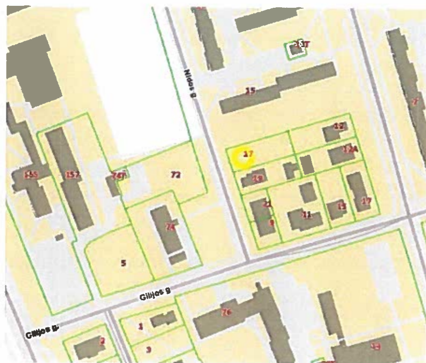
Pav. 1. Sklypo situacijos schema.

Koreguojamas detaliojo plano sklypas yra Klaipėdos pietvakarinėje miesto dalyje, netoli Nidos ir Gilijos gatvių sankirtos. Planuojamoje teritorijoje saugotinių objektų ir kultūros paveldo objektų, taip pat kitų inžinerinių statinių nėra.