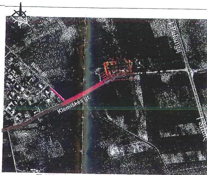
PLANUOJAMOS TERITORIJOS SCHEMA M 1: 5000

PATVIRTINTA KLAIPĖDOS MIESTO SAVIVALDYBĖS TARYBOS 2003 m. rugpjūčio mėn. SPRENDIMU NR. 1-298 Savivaldybės tarybos sekretoratas