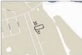
Zemės sklypo išdėstymo schema

Pertvarkomos teritorijos bendras plotas 0,1205ha