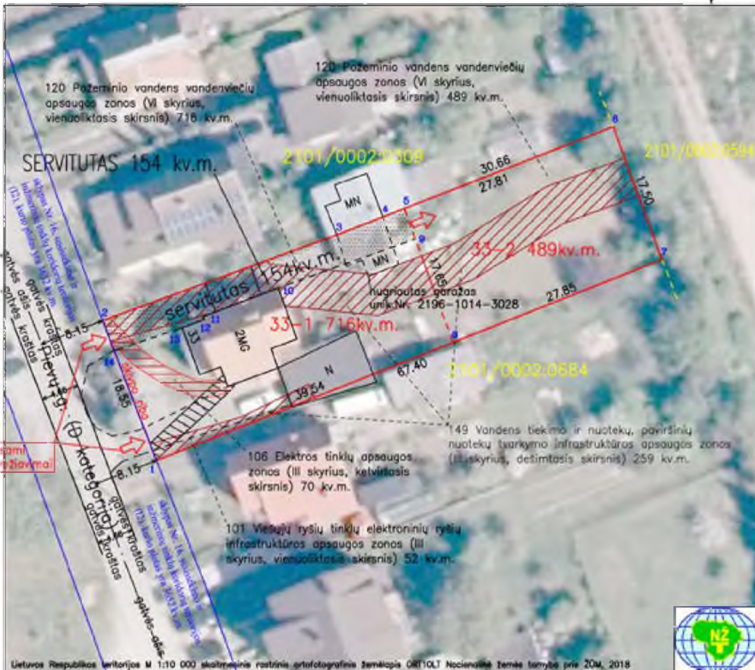
Lietuvos Respublikos teritorijos M 1:10 000 skaitmeninis rastinis ortofotografinis žemėlapis OR10LT Nacionalinė žemės tarnyba prie ŽŪM, 2018