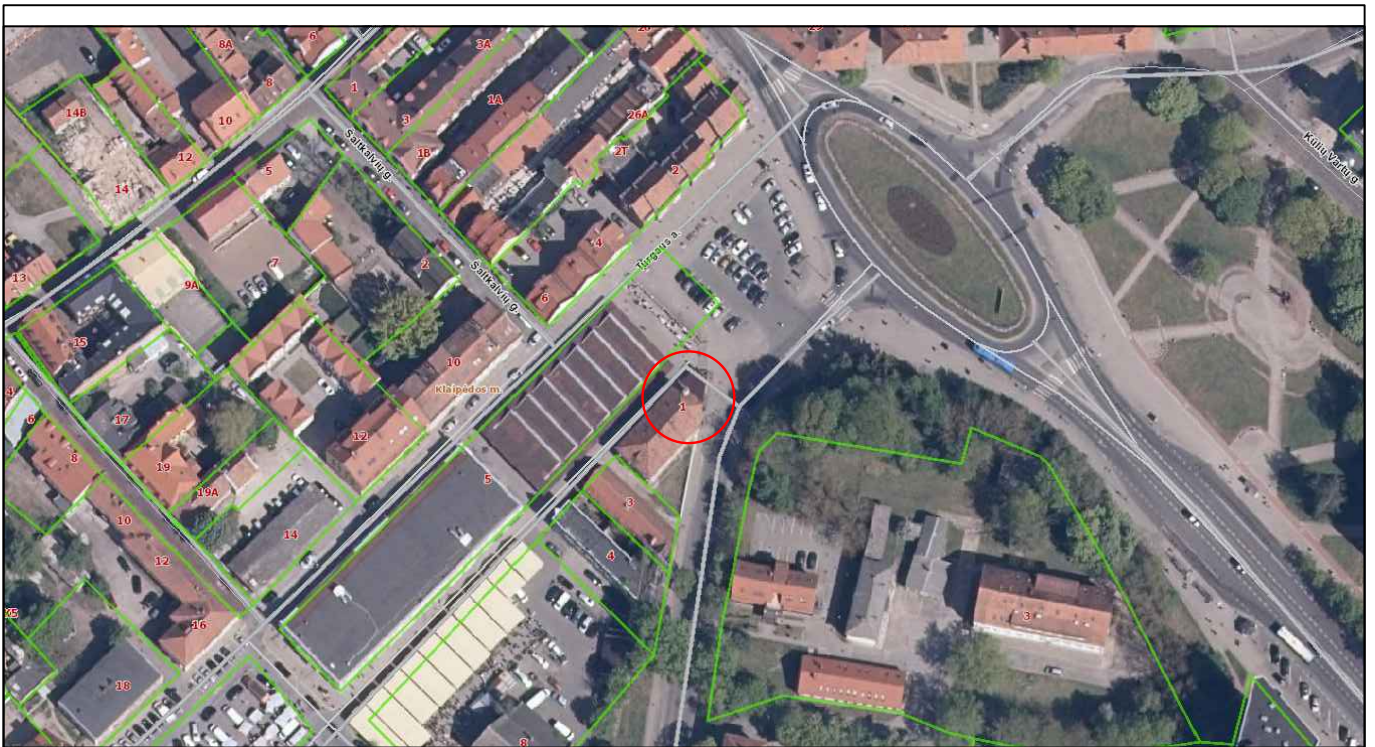
SITUACIJOS SCHEMA ŠTRAUKA IŠ ŽEMĖLAPIO WWW.REGIA.LT