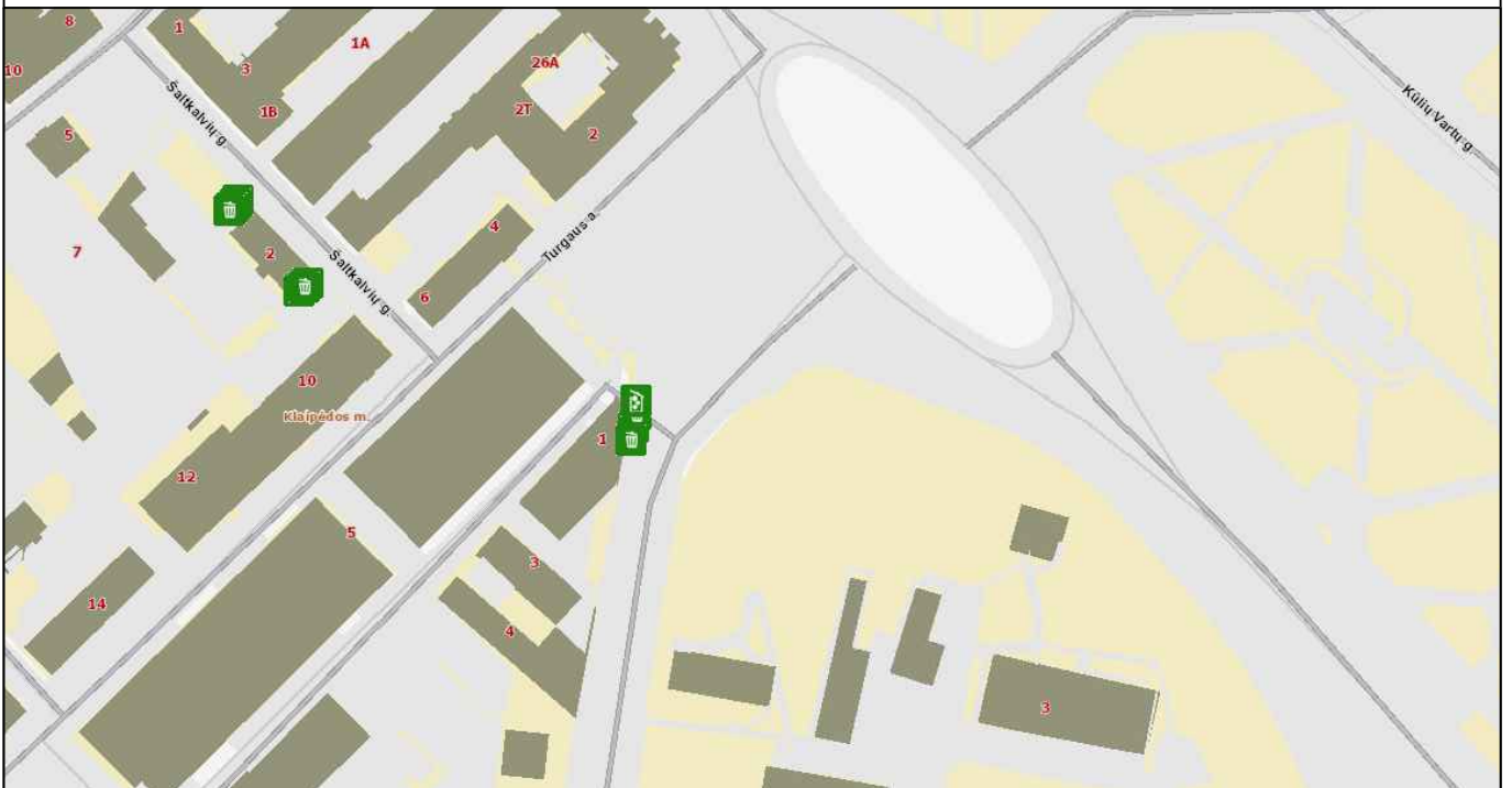
ATLIEKŲ KONTEINERIŲ VIETOS ŠTRAUKA IŠ ŽEMĖLAPIO WWW.REGIA.LT