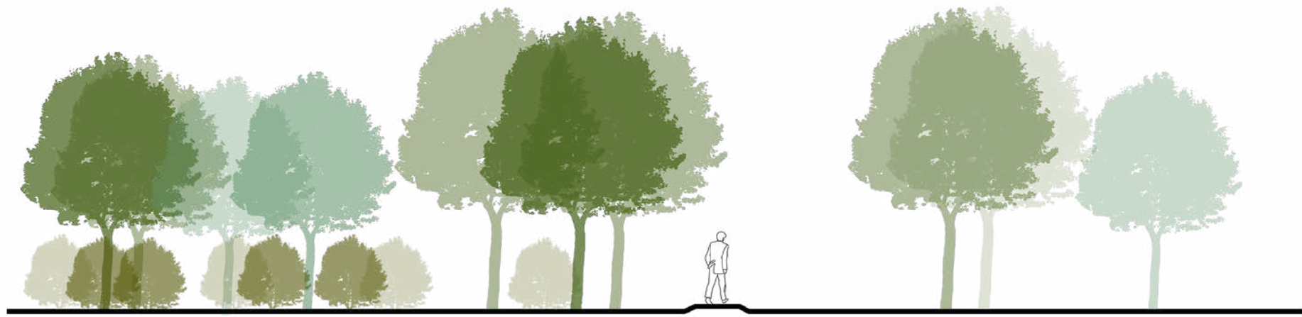
Parko medynų principinis pjūvis C