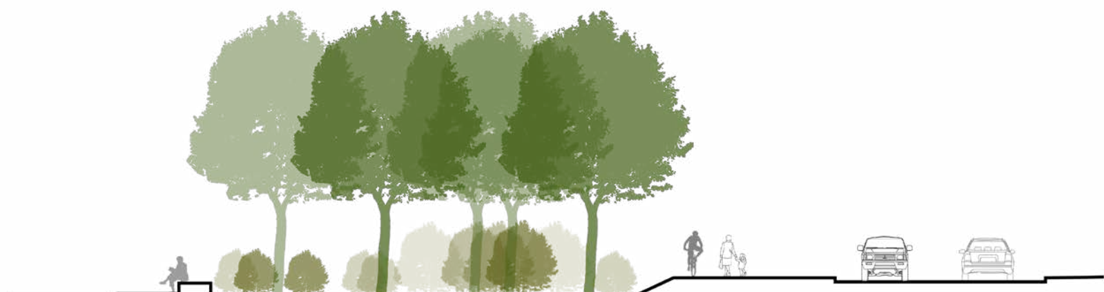
Apsauginės želdinių juostos principinis pjūvis B