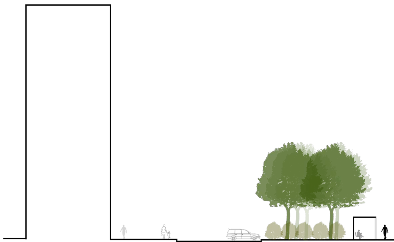
Edvės prie 10 a. gyvenamojo namo principinis pjūvis D - mašinų stovėjimo aikštelė, skiriamoji želdinių juosta, pergolė

Skiriami du pievų tvarkymo tipai: ekstensyvos priežiūros nešienaujamos žydinčios pievos ir intensyvos priežiūros pievos (vejos)