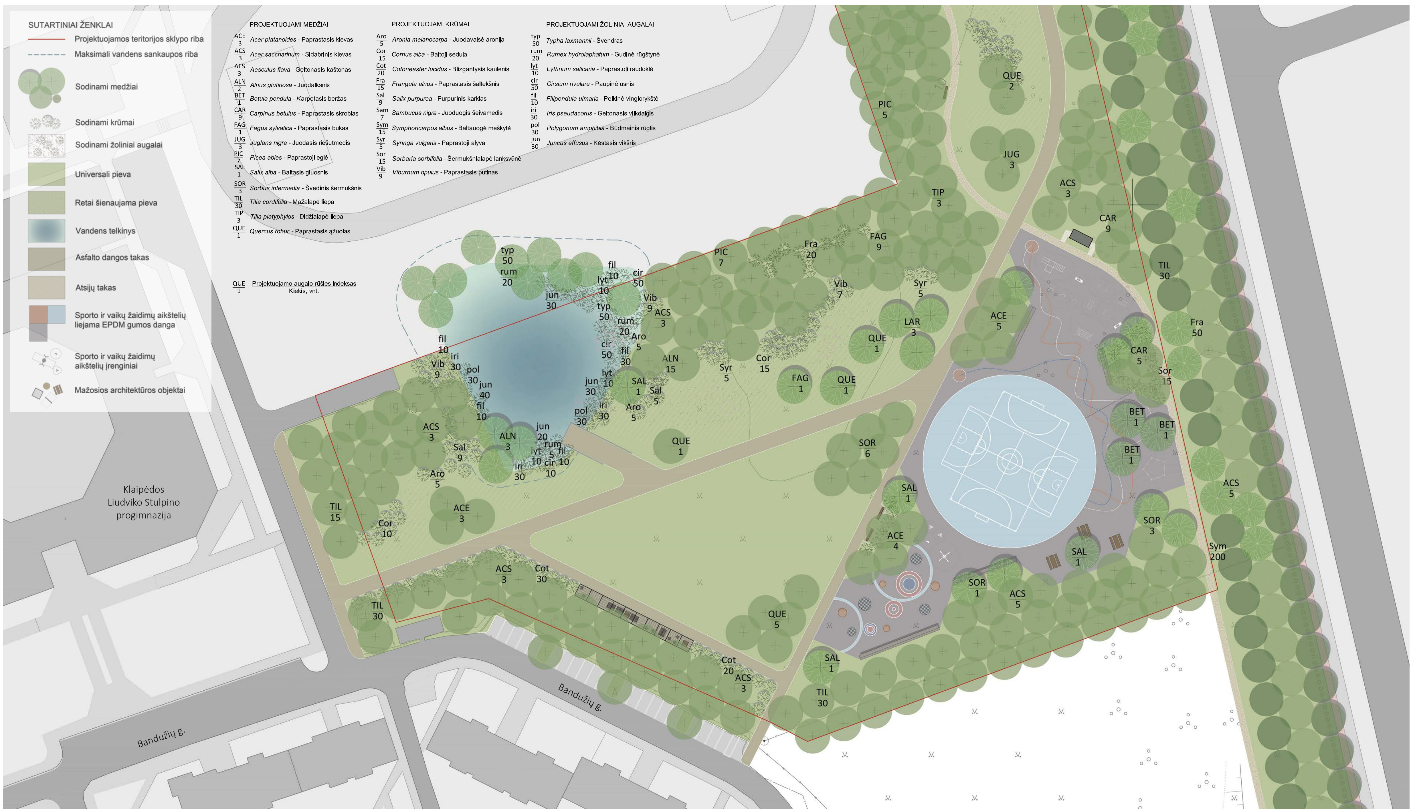
PIETINĖS PARKO DALIES FRAGMENTAS - ŽELDINIŲ IR MAŽOSIOS ARCHITEKTŪROS SPRENDINIŲ PLANAS M 1:500