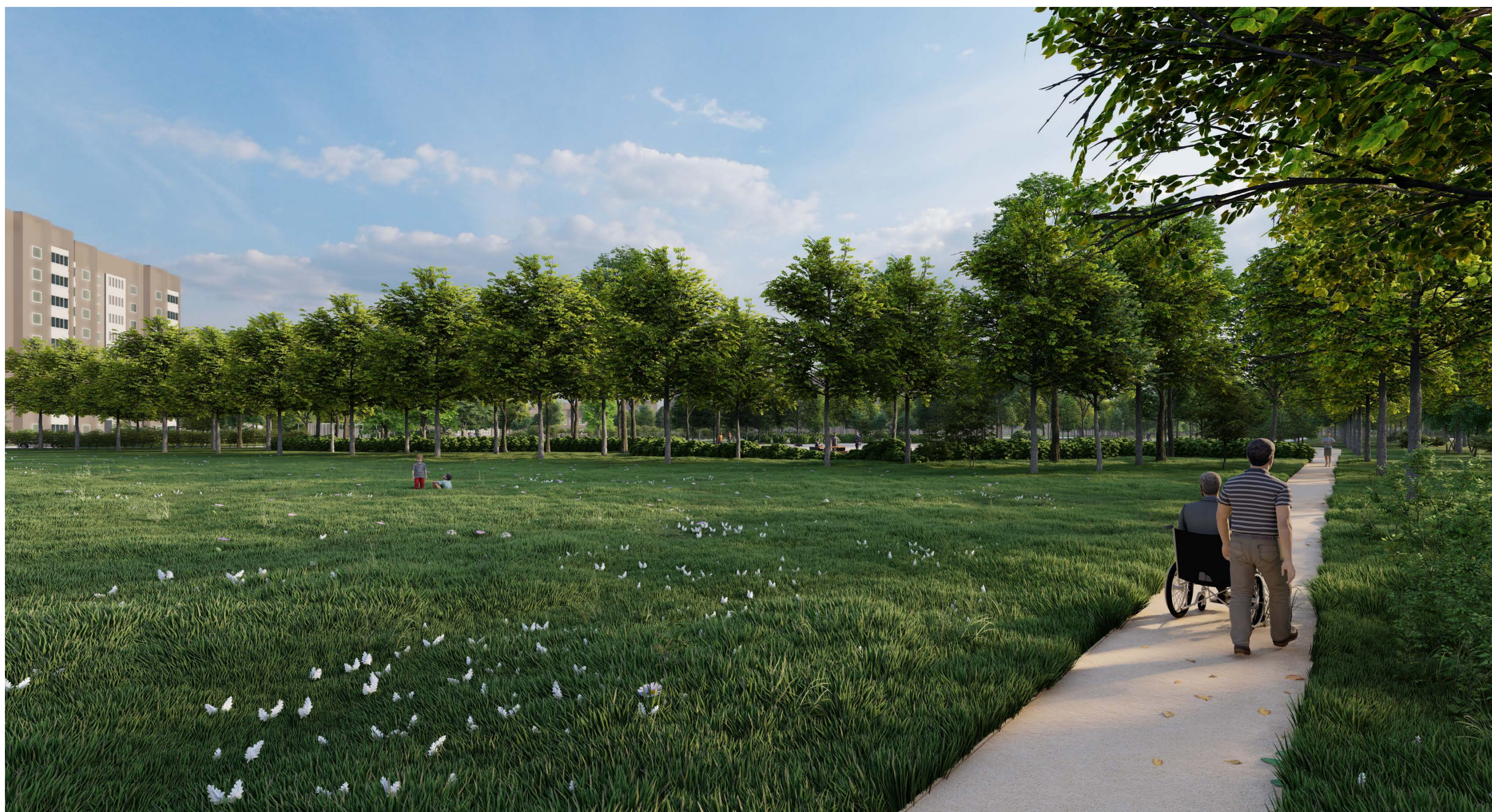
PARKO VAIZDAS NUO JŪRININKŲ PR. (IŠ APŽVALGOS TAŠKO NR. 4)