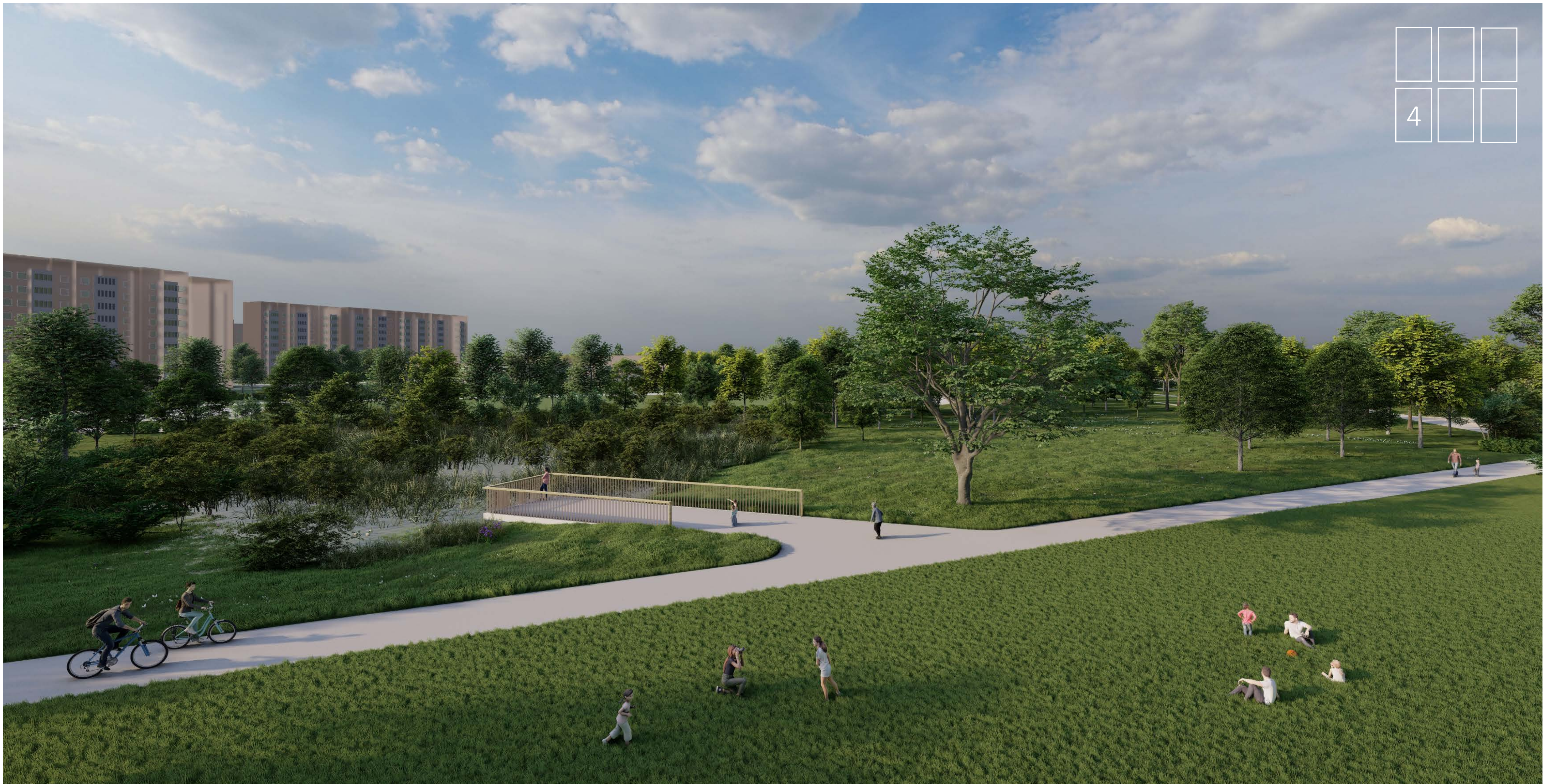
PIETINĖS PARKO DALIES PERSPEKTYVINIS VAIZDAS (IŠ APŽVALGOS TAŠKO NR. 3)