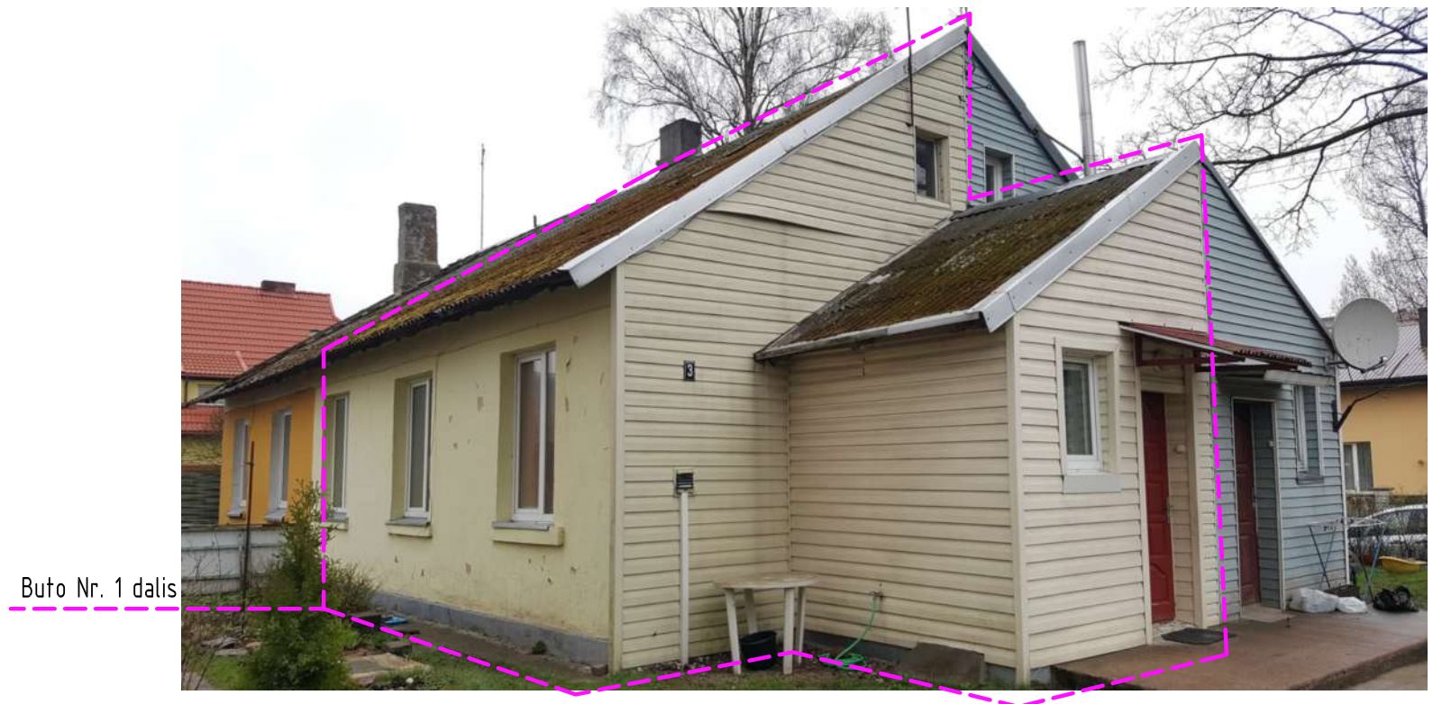
ESAMŲ FASADŲ 1-5, A-F FOTOFIKSACIJA