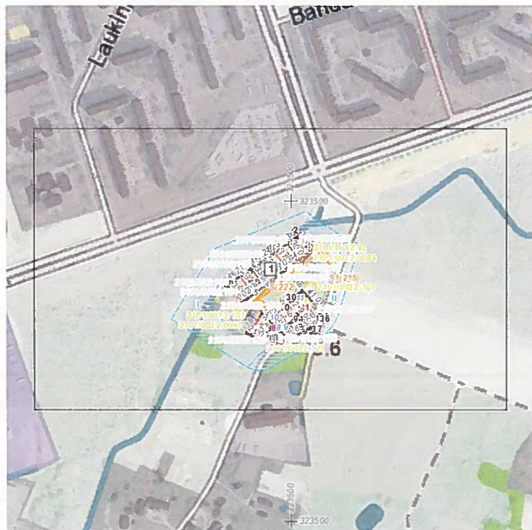
Situacijos schema, lapų išdėstymas