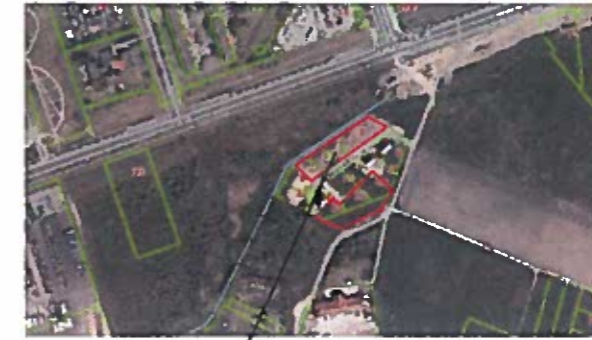
Planuojami žemės sklypai