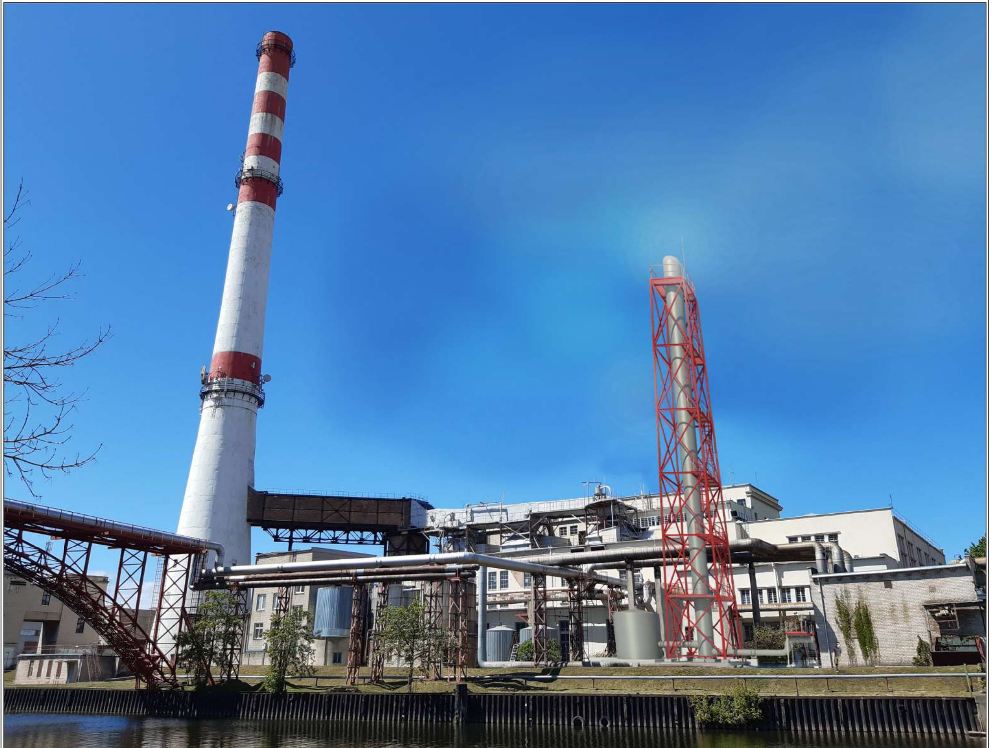
PROJEKTUOJAMO OBJEKTO ESAMA SITUACIJA