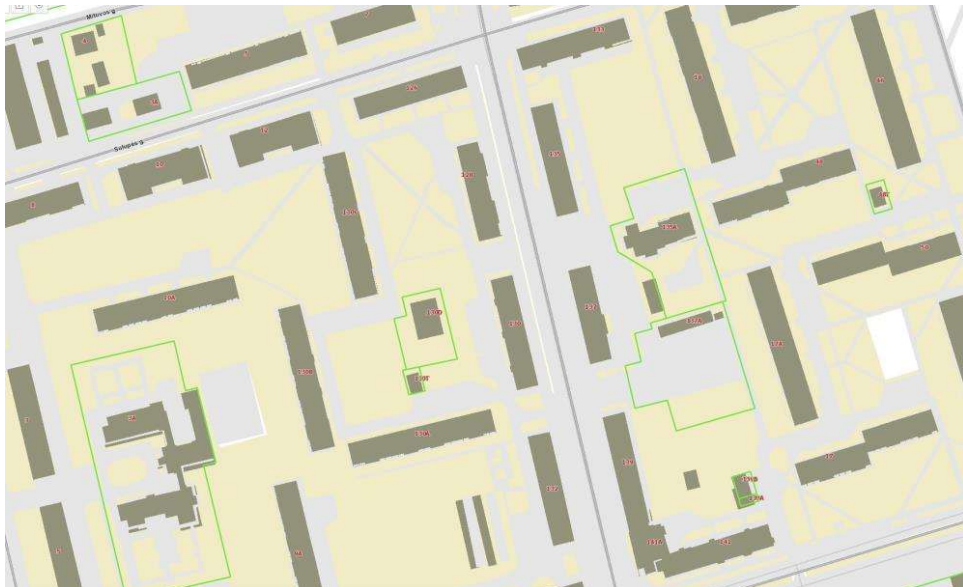
1 pav. Situacijos schema

Koreguojamas detaliojo plano sklypas yra Klaipėdos pietvakarinėje miesto dalyje, teritorijoje tarp Sulupės ir Minijos gatvių. Planuojamoje teritorijoje saugotinių objektų ir kultūros paveldo objektų nėra. Sklype ir šalia jo yra brandžių medžių.