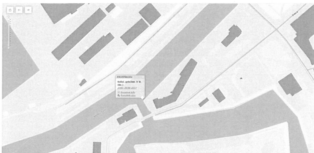
Unikalus Nr. 2100-2030-2027