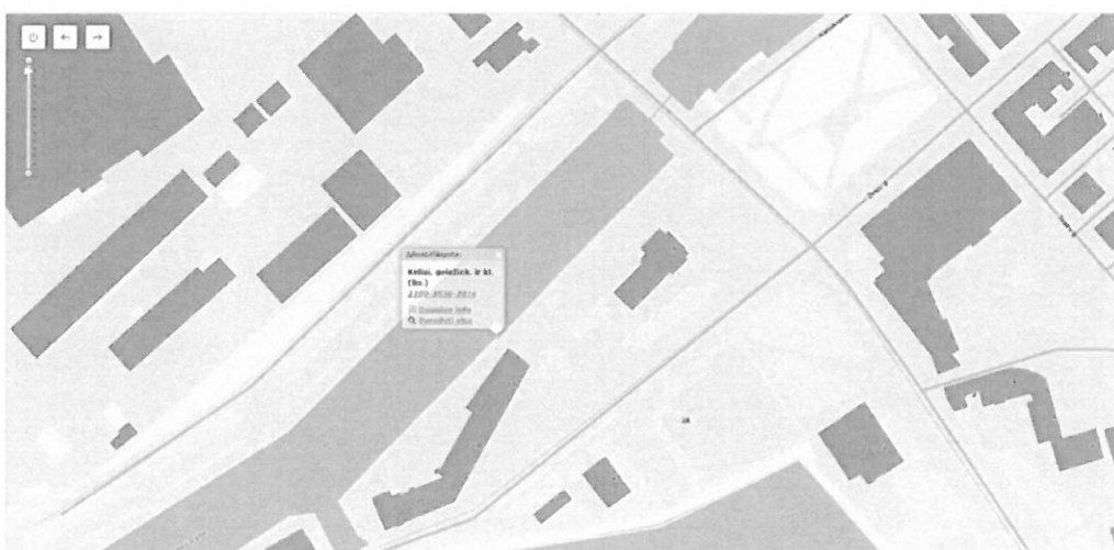
Unikalus Nr. 2100-2030-2016