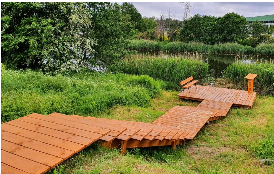
2 pav. Takelis ir aikštelė