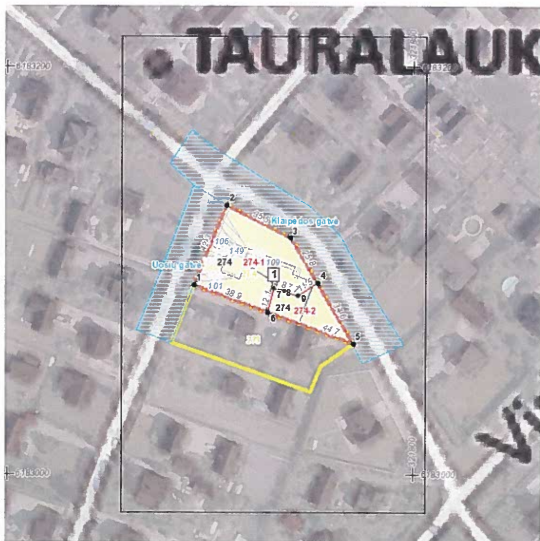
Situacijos schema, lapų išdėstymas