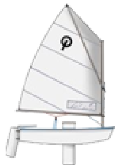
Optimist 18 vnt