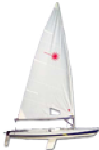
Laser: 7 vnt