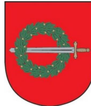
Klaipėdos rajono savivaldybė