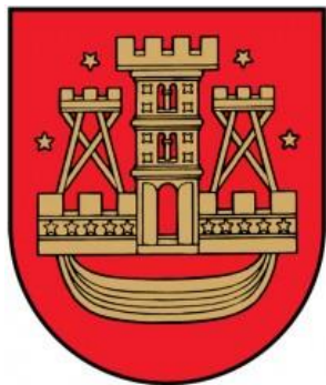
Klaipėdos miesto savivaldybė