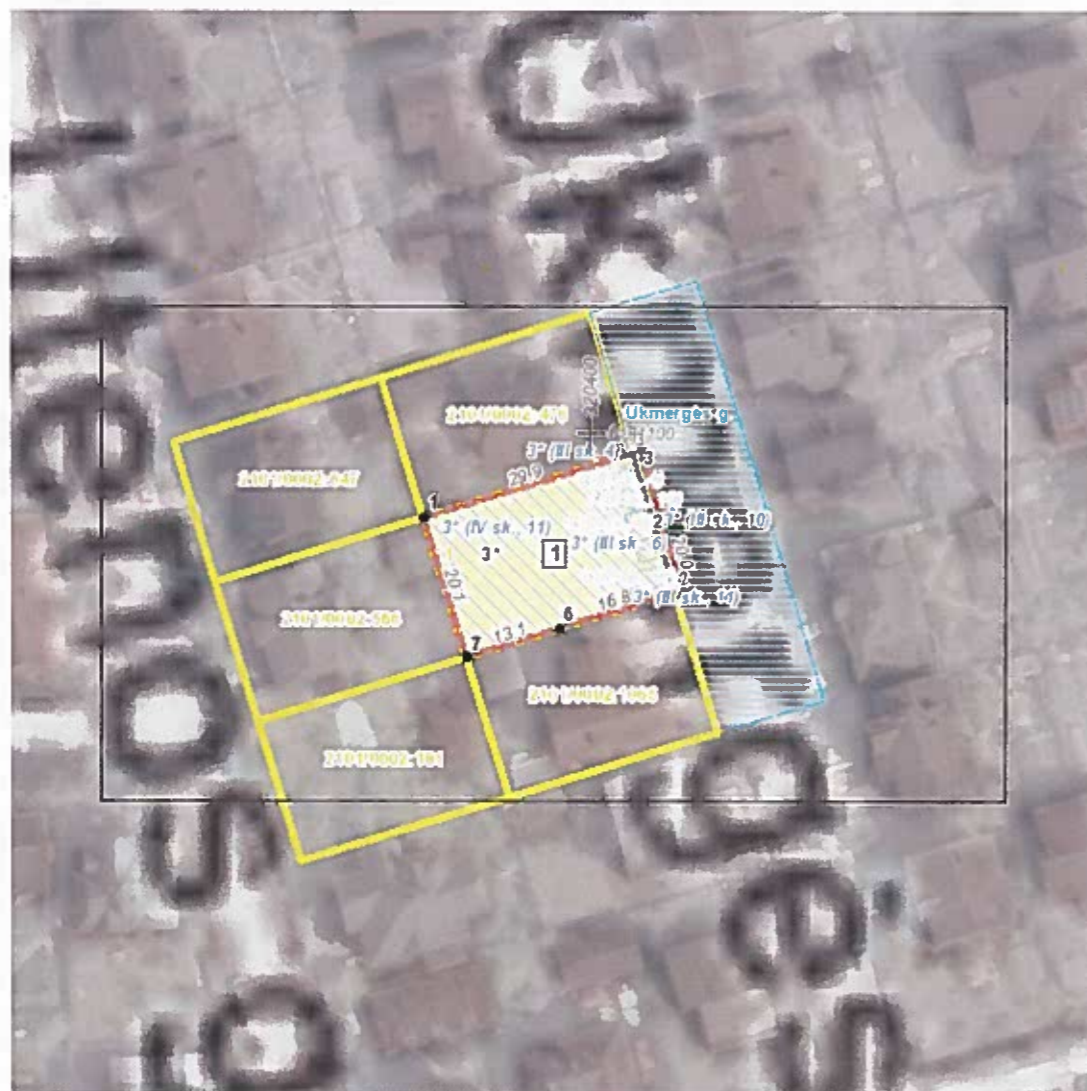
Situacijos schema, lapų išdėstymas