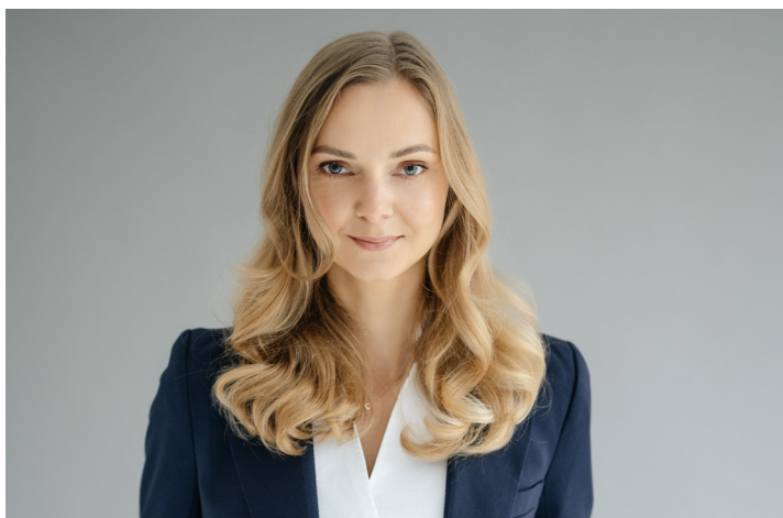
Talentų projektų vadovė laikinais einanti direktoriaus pareigas

Nepaisant iššūkių, norėtusi pasidžiaugti ir padėkoti visai komandai, kuri išlieka lanksti, motyvuota ir deda visas pastangas įgyvendinant įstaigos užduotis. Komandos įsitraukimas ir nuoširdus rūpestis Klaipėdos miesto ateitimi tikrai įkvepiantis ir suteikiantis optimizmo ateičiai. Didžiuojuosi, būdama tokios komandos dalimi.