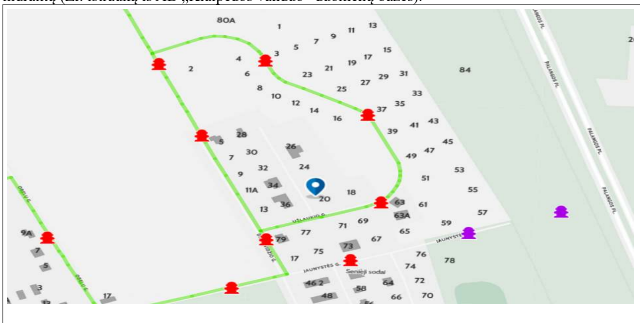
Ištrauka iš AB „Klaipėdos vanduo“ duomenų bazės

3.3 Išorės gaisro gesinimas. Numatomas iš Dienovidžio arba Užlaukio gatvėse esančių gaisrinių hidrantų (Žr. ištrauką iš AB „Klaipėdos vanduo“ duomenų bazės).