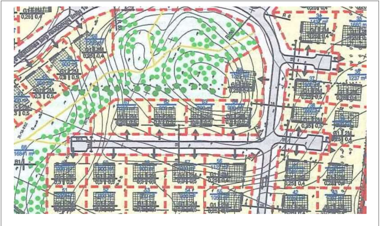
Ištrauka iš 2003-01-16 Klaipėdos miesto savivaldybės valdybos sprendimu Nr. 6 patvirtinto teritorijos prie Klaipėdos aukštesniosios žemės ūkio mokyklos ir Liepų gatvės tęsinio detaliojo plano koregavimo

Vadovaujantis 2003-01-16 Klaipėdos miesto savivaldybės valdybos sprendimu Nr. 6 patvirtinto teritorijos prie Klaipėdos aukštesniosios žemės ūkio mokyklos ir Liepų gatvės tęsinio detaliojo sprendiniais žemės sklype Užlaukio g. 20, Klaipėda nustatyti šie reglamentai: