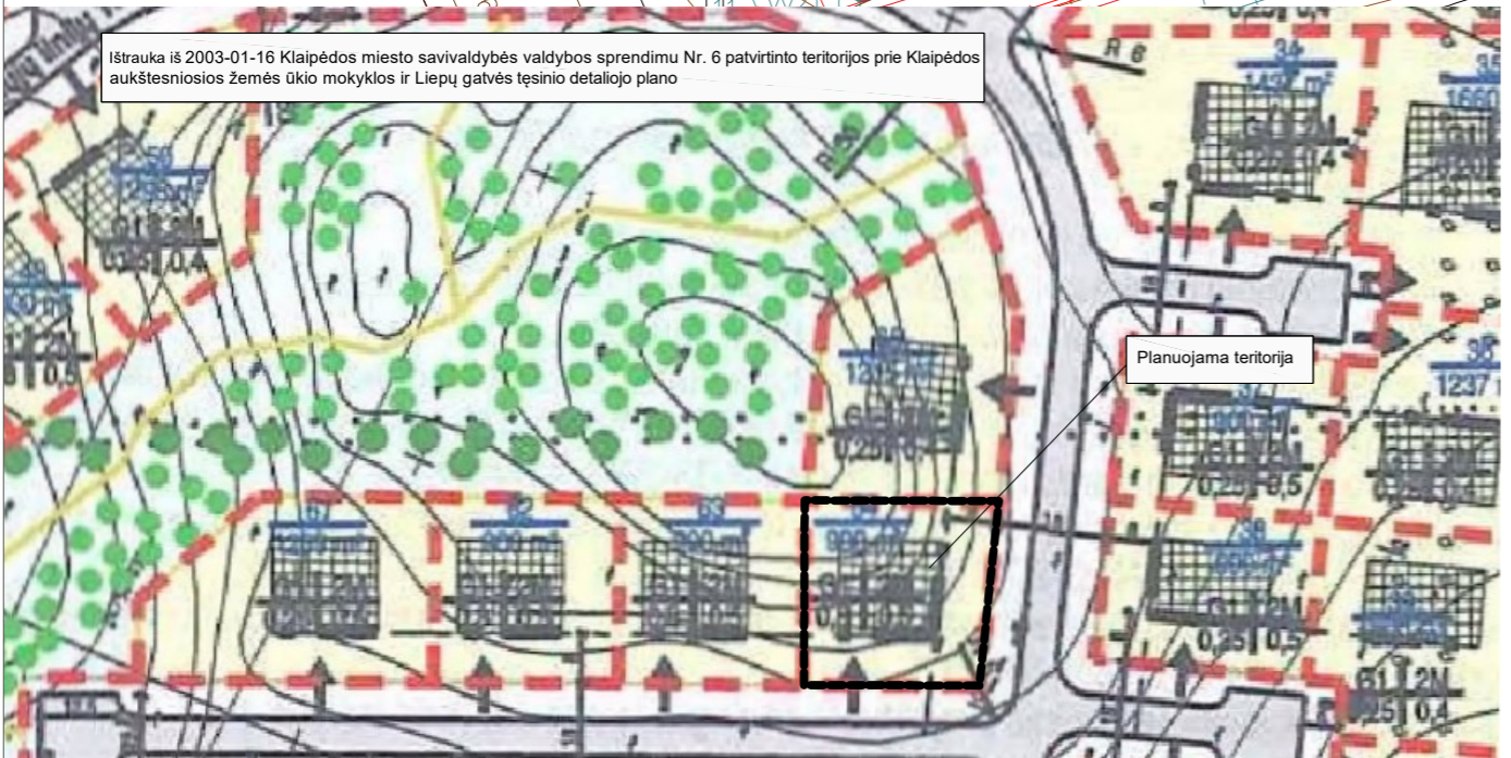
Ištrauka iš 2003-01-16 Klaipėdos miesto savivaldybės valdybos sprendimu Nr. 6 patvirtinto teritorijos prie Klaipėdos aukštesniosios žemės ūkio mokyklos ir Liepų gatvės tęsinio detaliuoju planu

PRITARTA: ..... (vardas, pavardė, parašas) ..... (vardas, pavardė, parašas)