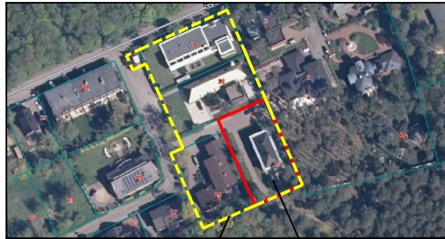
Koreguojamo DP riba