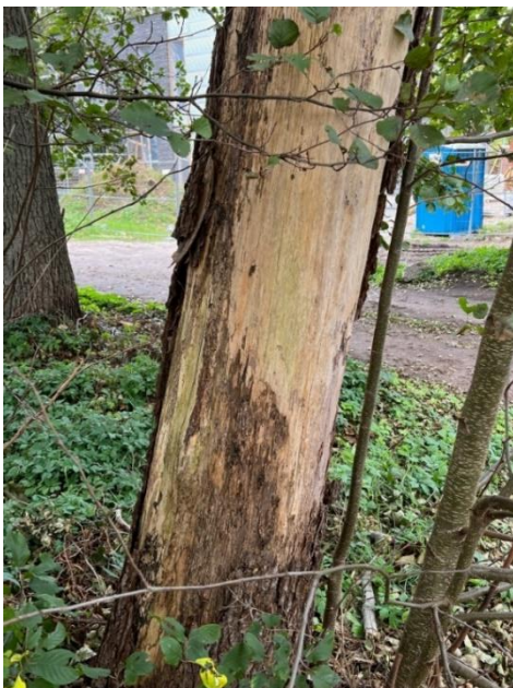
Juodalksnis Nr. 1

Vadovaujantis Bendroju planu, planuojamai teritorijai nustatytos apsaugos ir tvarkymo kryptys: Ts/4b,d , t.y. urbanizuotų/ numatomų urbanizuoti gamtinio karkaso teritorijų tvarkymas (4), teritorijos tvarkymo tipai – esamo želdyno įrengimo lygio ir būklės gerinimas (b) ir kraštovaizdžio natūralumą ir gyvybingumą atstatančių elementų integravimas ir atkūrimas pažeistose teritorijose (d). Vadovaujantis Priklausomųjų želdynų plotų normų apskaičiavimo tvarkos aprašu, mažiausias želdynams priskiriamas plotas rekreacinių teritorijų sklypuose gamtinio karkaso teritorijose – 50 %. Kadangi detaliojo plano rengimo stadijoje nėra aiškūs pastato/-ų parametrai, rengiant techninį projektą būtina užtikrinti esamo želdyno įrengimo lygio ir būklės gerinimą sklypo ribose suplanuojant naujų vertingų medžių sodinimą. Siūloma sodinti rūšis, būdingas pajūrio kraštovaizdžiui, pvz.: paprastoji pušis, juodoji pušis, karpotasis beržas ir kt. Naujai sodinamų medžių kiekis turi būti didesnis, nei pašalintų. Vadovaujantis Želdynų įrengimo ir želdinių veisimo taisyklių 5.4. punkto reikalavimais, medžiai veisiami ne arčiau kaip 5 m atstumu nuo pastatų sienų. Želdinių sprendiniai tikslinami STR ir kitų teisės aktų nustatyta tvarka techninio projekto rengimo metu.