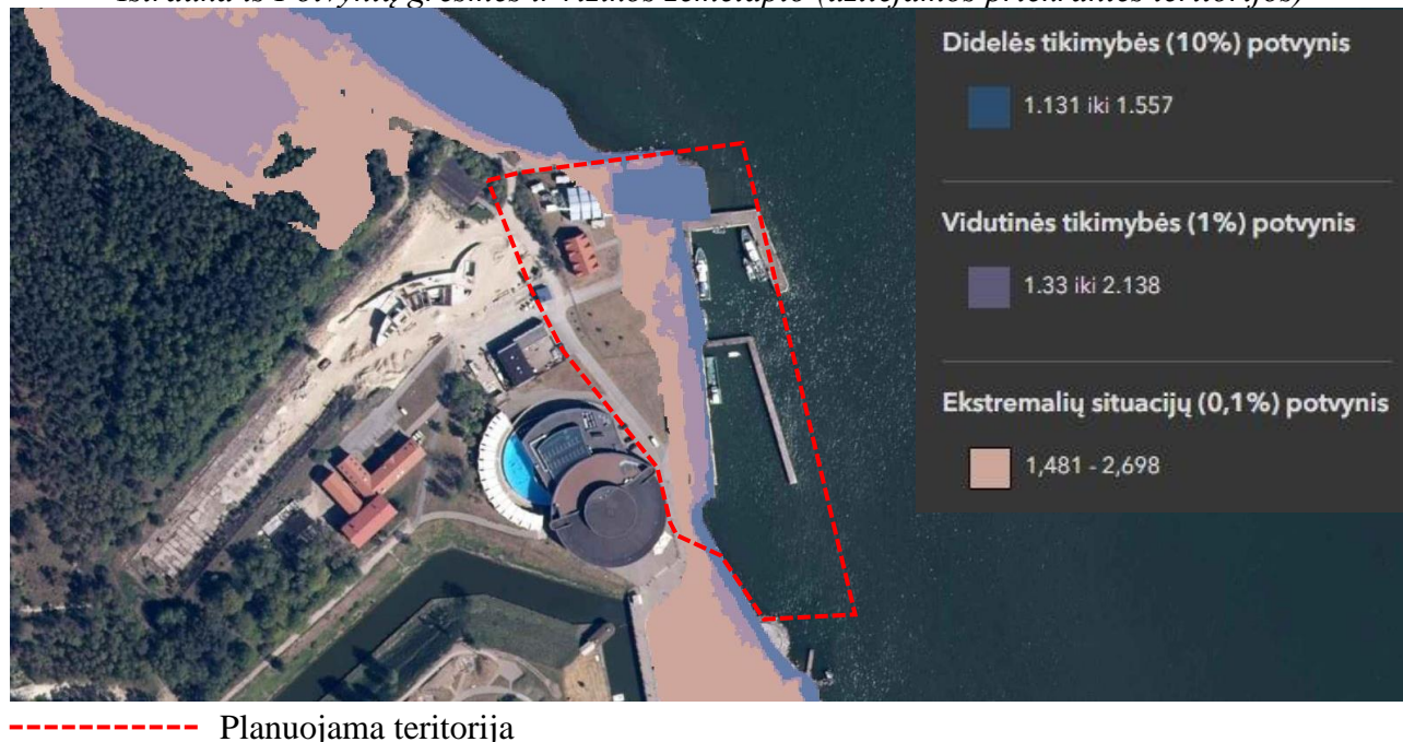
Ištrauka iš Potvynių grėsmės ir rizikos žemėlapiu (užliejamos priekrantės teritorijos)

*Kopgalio užkardos Smiltynės g. 2A detalusis planas, patvirtintas Klaipėdos miesto savivaldybės tarybos 2008 m. liepos 31 d. sprendimu Nr. T2-274 „Dėl Kopgalio užkardos Smiltynės g. 2A detaliojo plano patvirtinimo“.