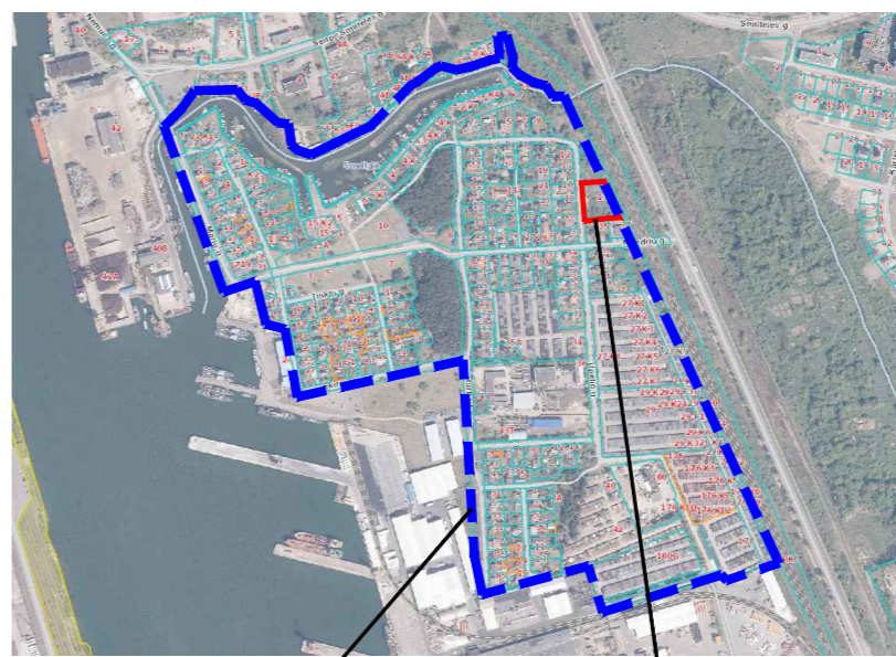
Nagrinėjama teritorija Planuojama teritorija